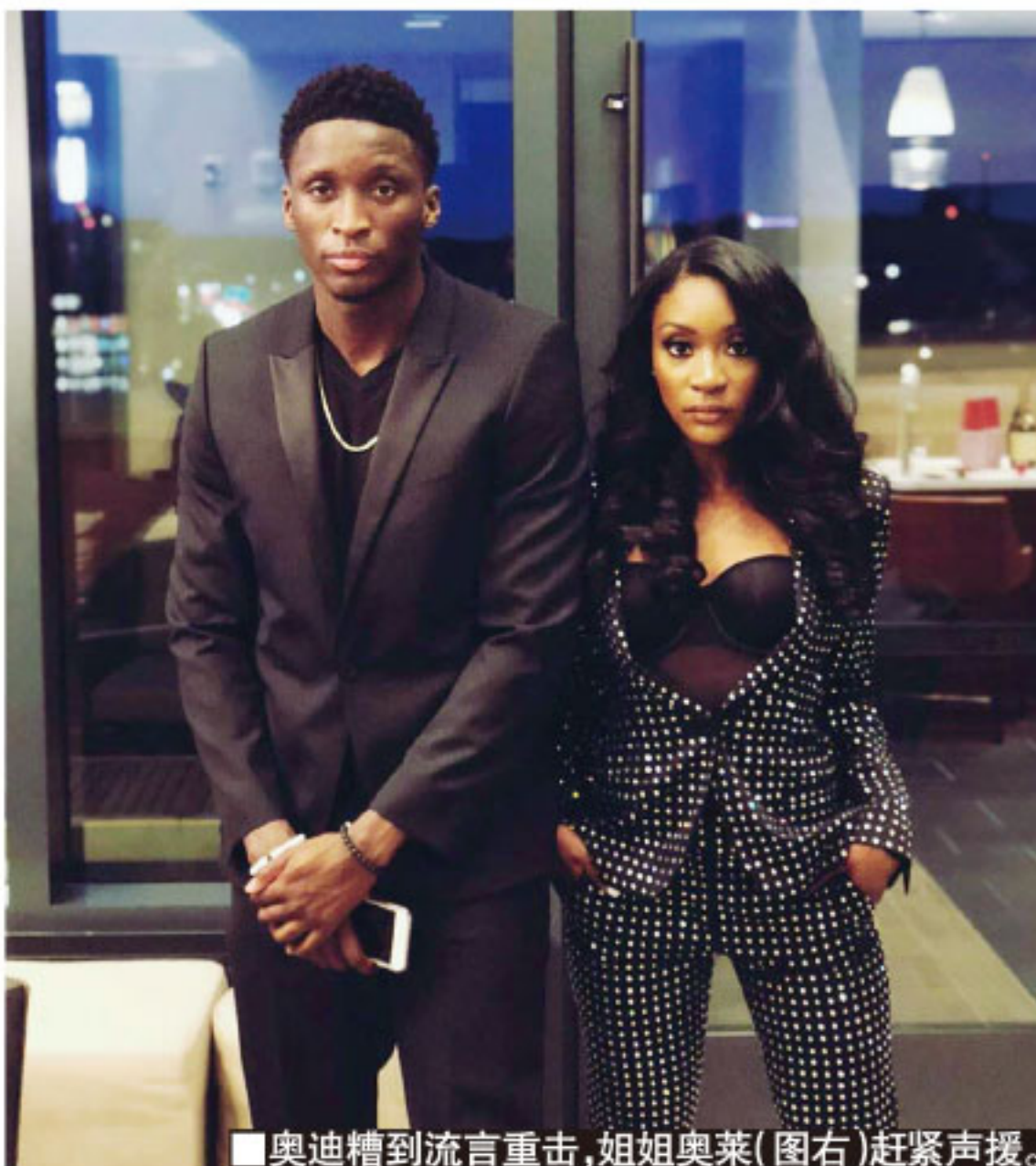
■奥迪遭到流言重击，姐姐奥莱(图右)赶紧声援。

迪波再次入选全明星，但去年 1 月份遭遇右膝肌腱断裂，让他出色的表现戛然而止。上赛季，奥拉迪波缺席了步行者的前 47 场比赛，而在复出后，他迟迟未能找到状态，场均只有 14.5 分、3.9 个篮板和 2.9 次助攻。在八月联盟复赛后，奥拉迪波曾经表示自己不会出战，但最终他还是出现在了赛场，只不过他所率领的步行者在季后赛首轮就被热火横扫。显然，奥拉迪波的竞技状态距离最佳水准相差甚远，这让步行者很难为他送上一份可观的续约合同，双方之间的