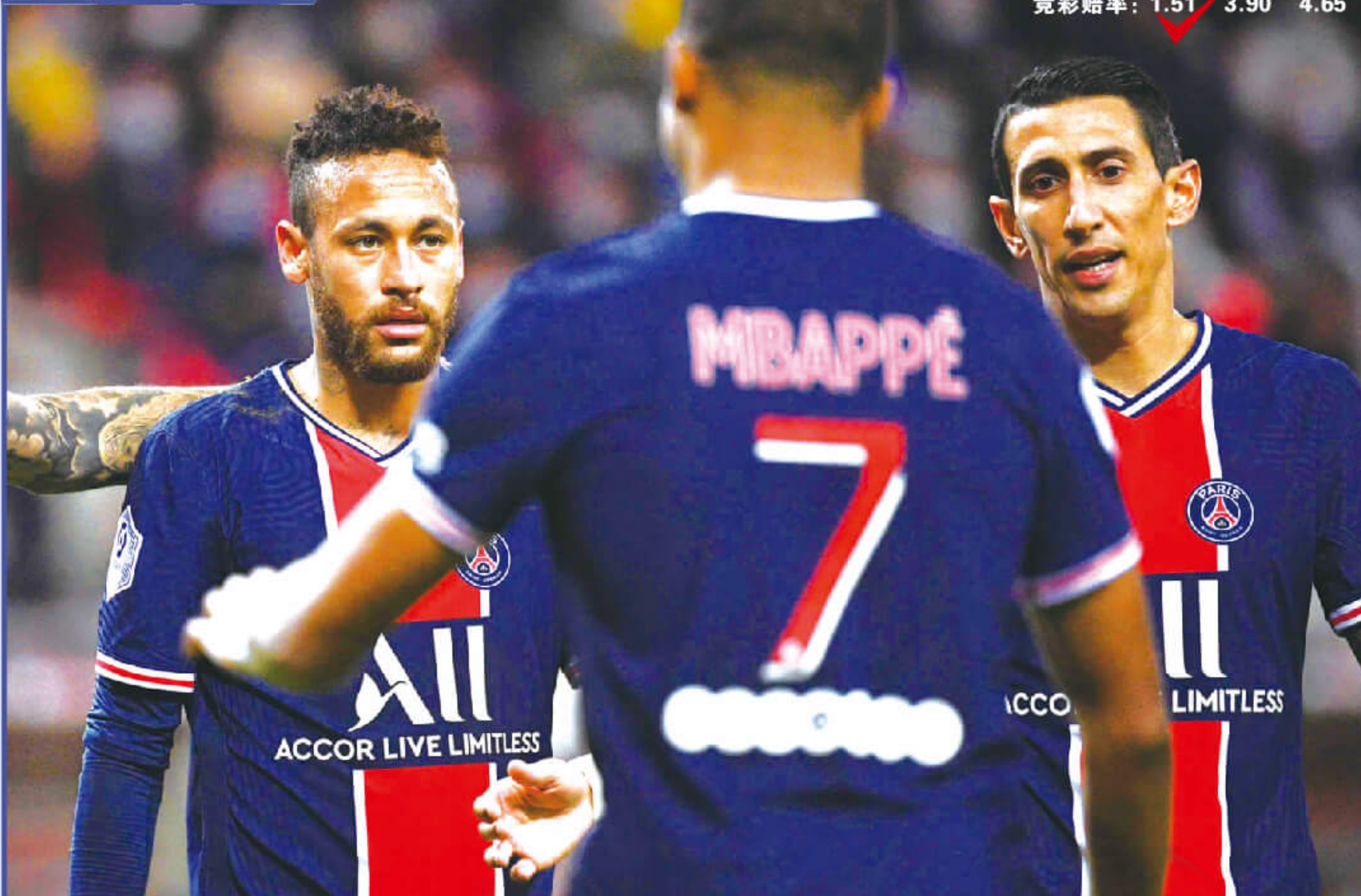
曼联压哨签下的“神锋”卡瓦尼本战倒戈旧主，巴黎队史射手王回到王子公园球场面对内马尔、姆巴佩和迪马利亚的进攻“三叉戟”，大战难免……