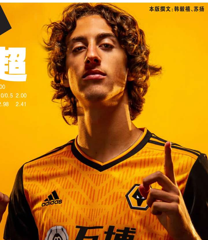
本版撰文:韩毅禧、苏扬

谢菲尔德联上赛季以升班马的身份成为联赛黑马,不过收官3连败的表现让他们最终只能以第9名的成绩结束赛季。这个夏季转会窗,他们的最大支出是从降级的伯恩茅斯处签下门将拉姆斯代尔,他也将直接顶替租借期满回归曼联的上季主力门将迪恩·亨德森。同时,他们还从切尔西续租年轻中卫阿姆帕杜,德比郡的两名边后卫博格和马克斯·洛的加盟转会费也不高。首轮联赛,主帅怀尔德手中还有几名球员有轻伤,包括