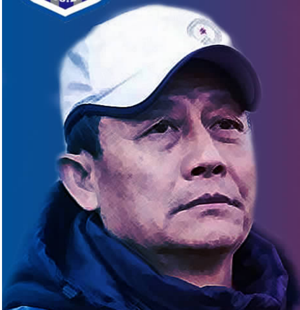
本版撰文：苏扬、刘超华