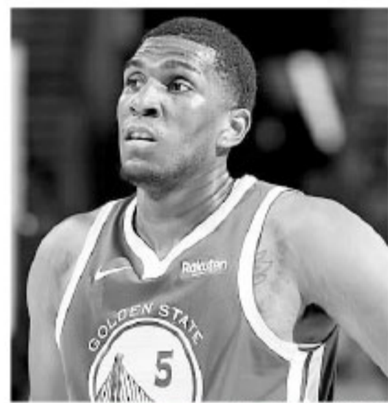
▲鲁尼同样在勇士的计划当中,但他已经落后于克里斯了。

不过这份底薪合同最终成为了鲁尼鞭策自己的动力,上赛季他场均仅出战18.5分钟就能贡献6.3分和5.2个篮板,被认为是勇士首发中锋的有力竞争者。勇士也很看好鲁尼的发展前景,去年休赛期和他达成一份3年1500万美元的续约合同,将其纳入未来计划当中。