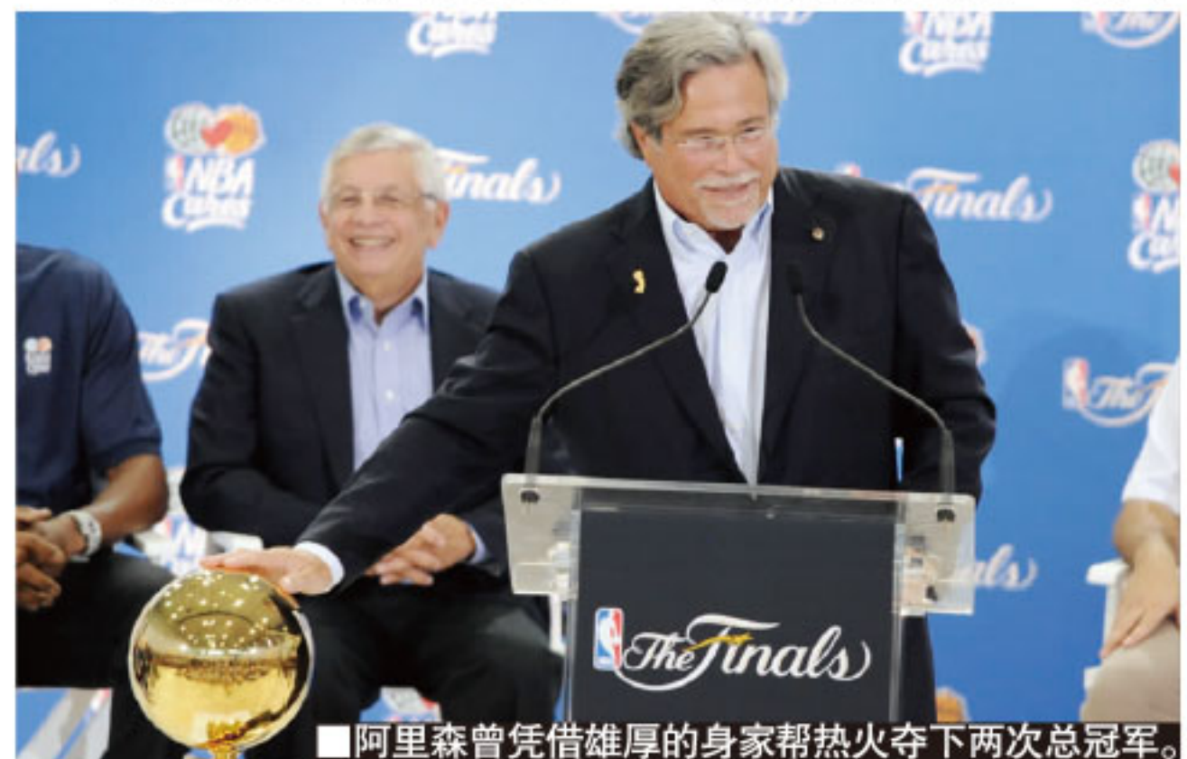
■阿里森曾凭借雄厚的身家帮热火夺下两次总冠军。