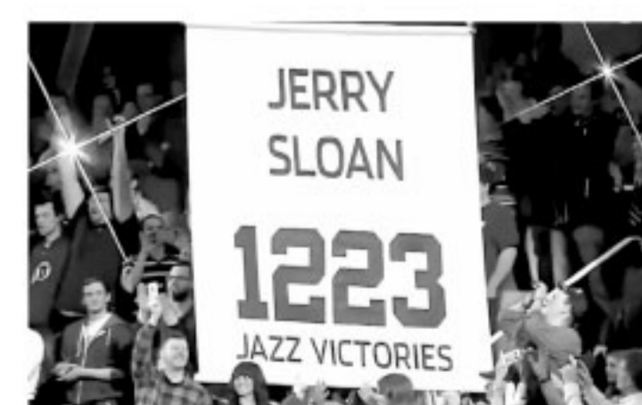
▲2014年爵士为斯隆退役了特殊的1223号球衣。

谈起爵士时,球迷肯定会想到马龙和斯托克顿这对NBA历史上最伟大的挡拆组合,他们也确实是这支球队的标志性人物。但不要忘记,斯隆对爵士的意义还要在这两位球星之上,就像爵士在官方声明当中所说的那样,斯隆在某种意义上等同于爵士,他也定义了这支球队。如今,斯隆已经作古,但他的精神将永远传承下去,指引一代又一代爵士球员继续前行。