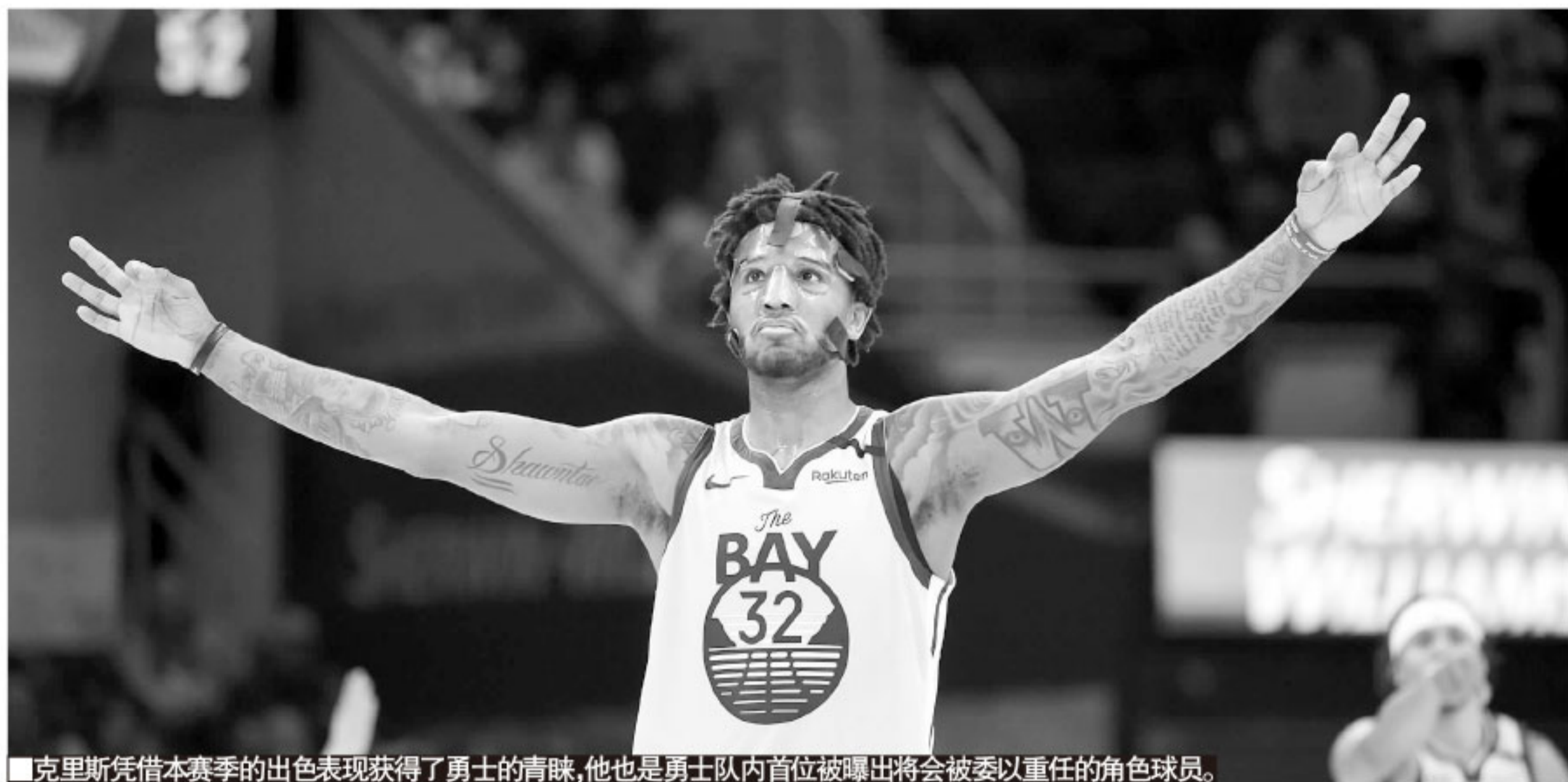
▲克里斯凭借本赛季的出色表现获得了勇士的青睐,他也是勇士队内首位被曝出将会被委以重任的角色球员。