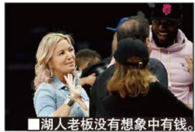
■湖人老板没有想象中有钱。

尽管 NBA 正积极计划以空场的形式复赛,不过这对湖人的打击还是很大:球票和周边产品的收入对湖人而言非常重要,空场比赛意味着这部分收入将落空。本赛季湖人拥有詹姆斯和“浓眉哥”安东尼·戴维斯两大巨星,搭配一众实力派角色球员,在球员工资上投入大量金钱,目标正是要时隔七年重返季后赛乃至夺冠。眼下这一波疫情突然撕下了湖人光鲜的外表,也令他们的夺冠之路出现变数。