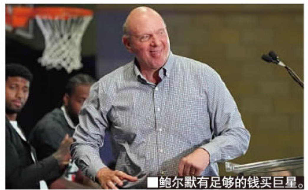
■鲍尔默有足够的钱买巨星。

鲍尔默之所以这么霸气,除了因为他本身实力雄厚,还在于互联网行业在疫情期间保持坚挺。过去的12个月中,微软的股市指数上涨了30%,于是强劲云计算推动鲍尔默的净资产增加了115亿美元,最终达到了现有的527亿美元。灾难之中,同人还真是不同命。