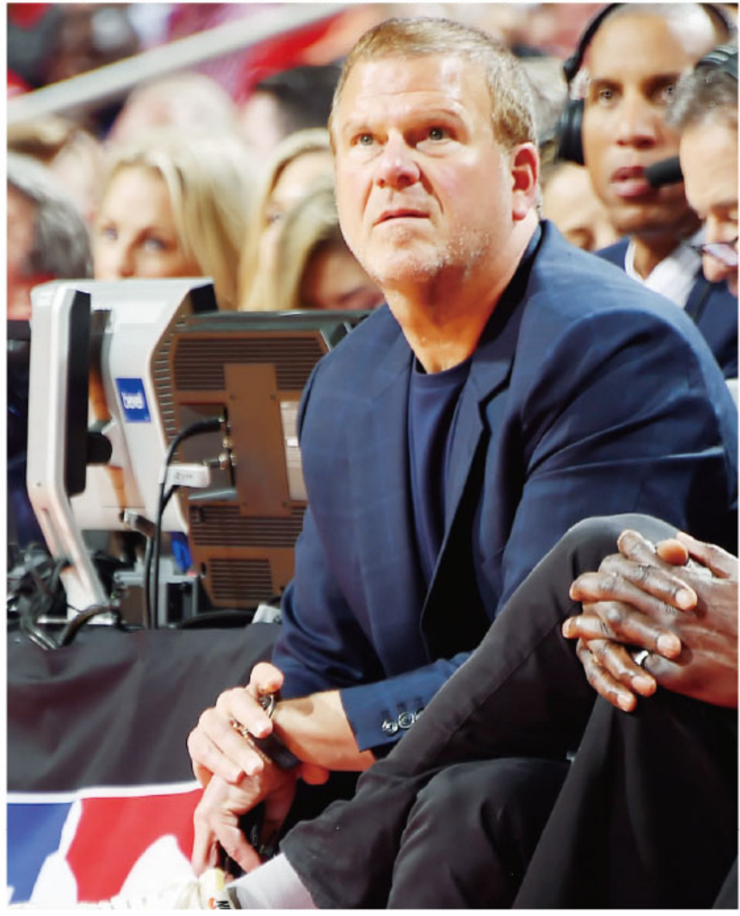
▲费尔蒂塔和他的火箭这个赛季就没有过好日子。