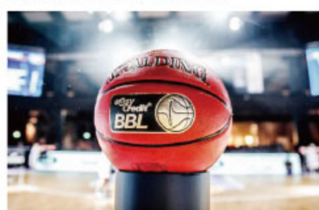
▲在复赛筹备方面,德国篮球跟足球一样“刚”。

在西班牙的联赛举棋不定且倾向于取消赛季之前,法国人、立陶宛人、意大利人和土耳其人已经迈出了“赛季取消”的一步。意大利作为欧洲早期疫情最严重的国家,在三月底就宣布国内所有篮球联赛全部取消,而立陶宛联赛也在三月份做出同样的决定,只不过他们宣布常规赛榜首球队萨拉基利斯直接获得本赛季的冠军。