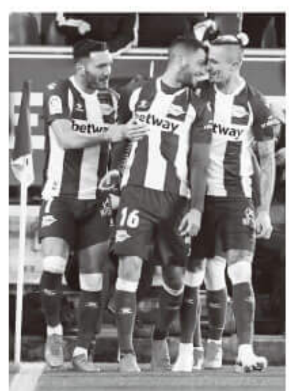
▲继巴伦西亚之后,阿拉维斯队内也有多人感染新冠病毒。

其他足坛人士方面,本周也有新增的确诊者,包括瑞士足协主席多米尼克·布兰克、日本足协主席田岛幸三和德丙哈勒舍队主席扬斯·劳申巴赫。