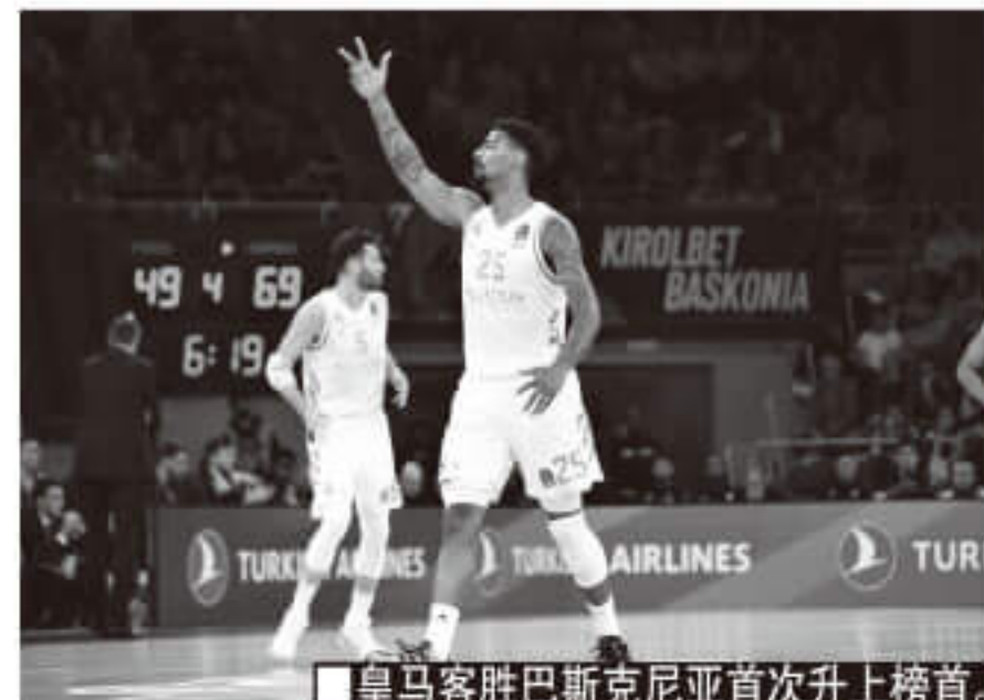
皇马客胜巴斯克尼亚首次升上榜首