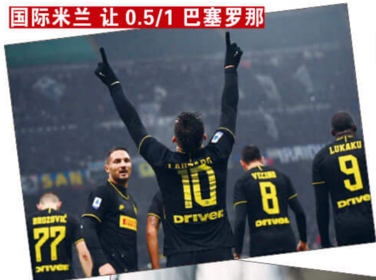
国际米兰 让 0.5/1 巴塞罗那