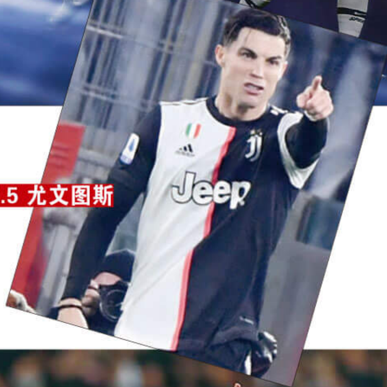
勒沃库森 让 0.5 尤文图斯