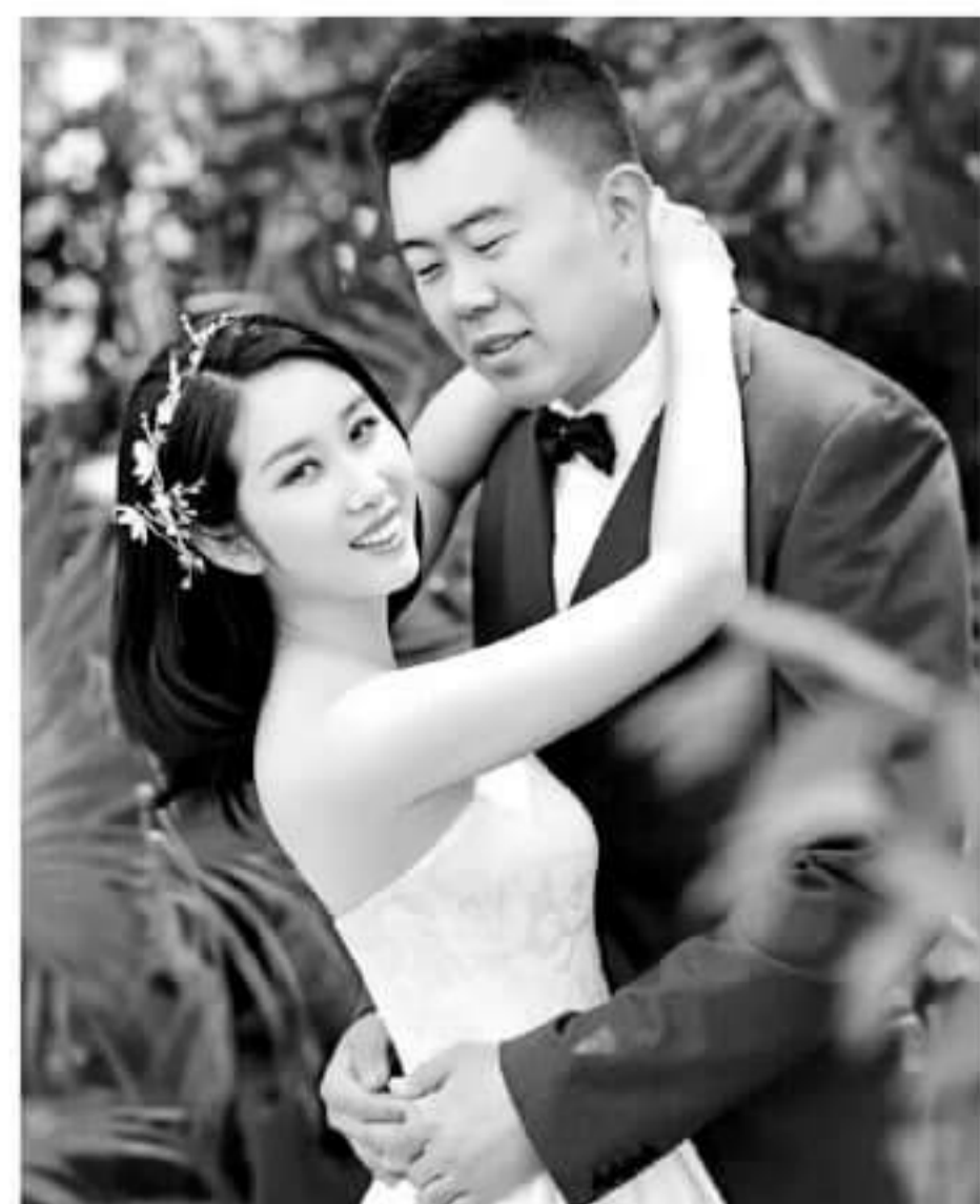
▲辽宁中锋韩德君将在近期补办婚礼，最近他的一组婚纱照在网上公开。有网友评论道：“郎才女貌，祝福大韩。”