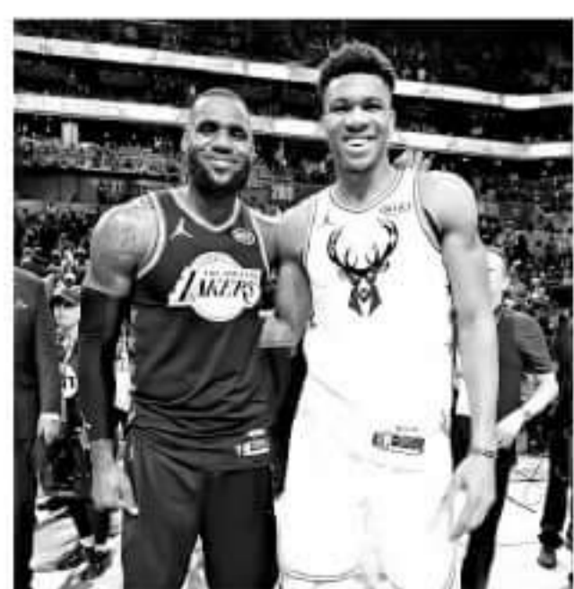
▲字母哥还无法达到詹皇的统治力。

自从詹姆斯加盟湖人之后,字母哥就被看好取代詹皇继续统治东部,然而单从第六战乃至整轮系列赛的表现来看,字母哥要想接班詹姆斯还为时尚早,他需要变得更