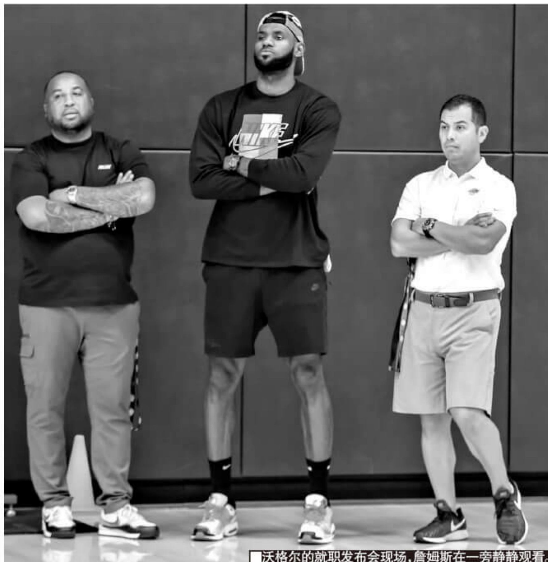
沃格尔的就职发布会现场,詹姆斯在一旁静静观看。

这就需要湖人管理层的努力。在“魔术师”约翰逊主动辞职之后,湖人队进行了较大的变动,以沃顿为首的教练组被悉数辞退,新上任的主帅沃格尔身边是有着主帅经验的基德。不过终究,这支好莱坞的球队还是需要巨