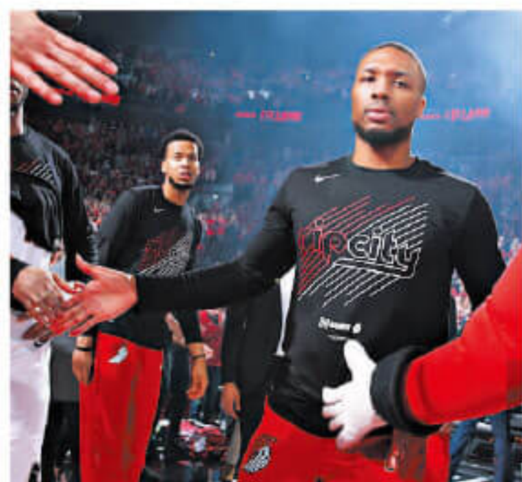
▲如果能够顺利签下这份合同，利拉德基本和开拓者绑定了。

目前利拉德身上的合同是2015年休赛期签下的5年1.2亿美元，本赛季的薪水为2798万美元。然而如今超级合同漫天飞舞，利拉德当然也希望能够拿到更高的薪水，而这一次再度入选最佳阵容，他