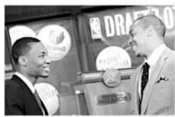
▲2013年开拓者选中迈克勒姆时，利拉德到场祝贺。

而更重要的是，他们会及时鼓励对方，然后一起前进。当初利拉德0.9秒绝杀火箭率队打进季后赛次轮的时候，迈克勒姆还没有进入球队的常规轮换，但他却在别人交口称赞利拉德有多么给力时，鼓励他继续提升实力。后来迈克勒姆在2015-16赛季荣膺最快进步奖，利拉德也送上了自己的鼓励，就算别人说迈克勒姆和他一样好，他也希望小兄弟能做得更好。