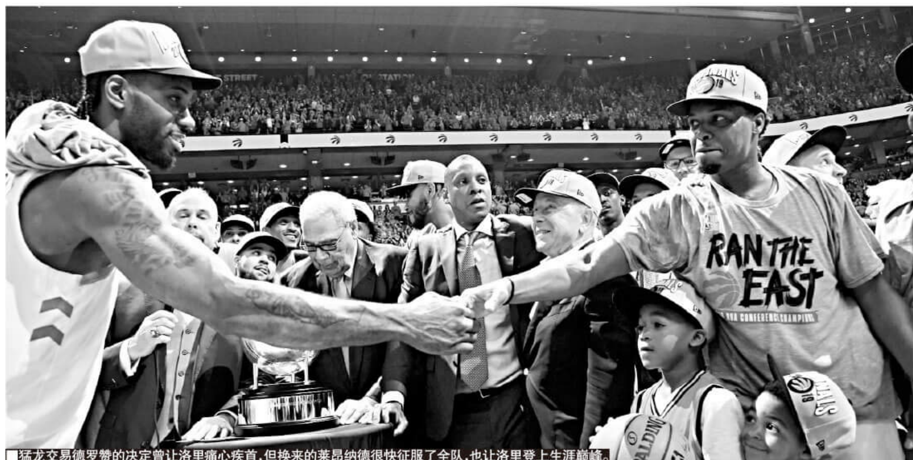
猛龙交易德罗赞的决定曾让洛里痛心疾首,但换来的莱昂纳德很快征服了全队,也让洛里登上生涯巅峰。