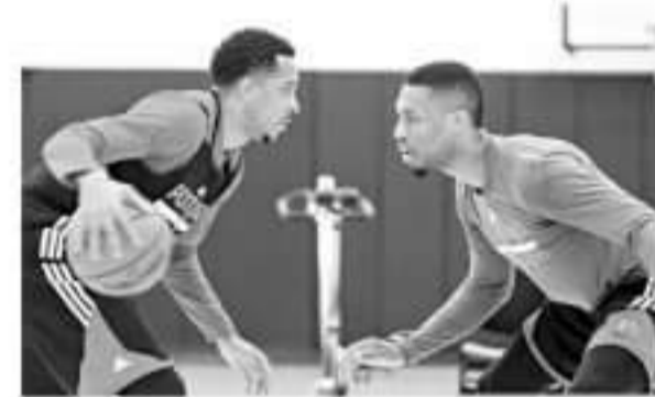
▲训练场上他们也会一对一单挑，看看谁更强。

契的合作影响到了开拓者的其他球员，这也使得球队更衣室的氛围非常棒，让球队变得更有凝聚力。“他们为什么而训练？因为他们想要彼此合作，”特纳说，“他们在场上和场下都非常亲近，这是一种无私的表现。这很能充分为他们两人代言。”