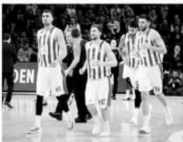
▲红军下赛季或跟TA马卡比一样,让一队只出战欧冠。

据了解,奥林匹亚科斯和帕纳辛纳科斯都对希腊联赛的裁判有所不满,其中红军的反应更加激烈,他们提出要在希腊季后赛期间动用非希腊籍裁判才能保证比赛的公正。不过这样的要求被希腊篮协拒绝了,于是奥林