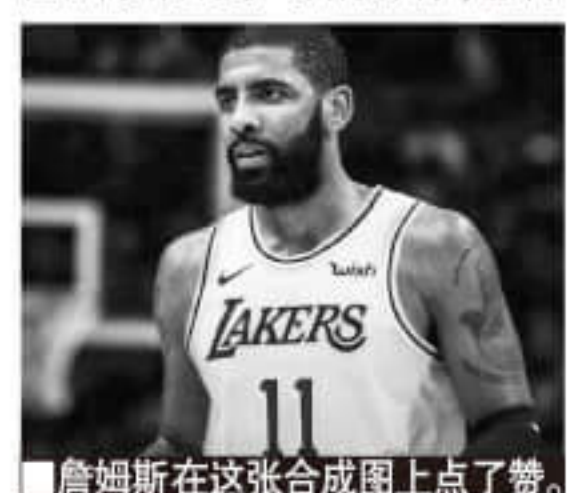
詹姆斯在这张合成图上点了赞。

据美媒报道,詹姆斯在私下接触过莱昂纳德和巴特勒,其中效力于76人的巴特勒已经在季后赛中被淘汰出局,他即将在今夏成为自由球员,而莱昂纳德则还在随猛龙一起征战季后赛。有消息称,巴特