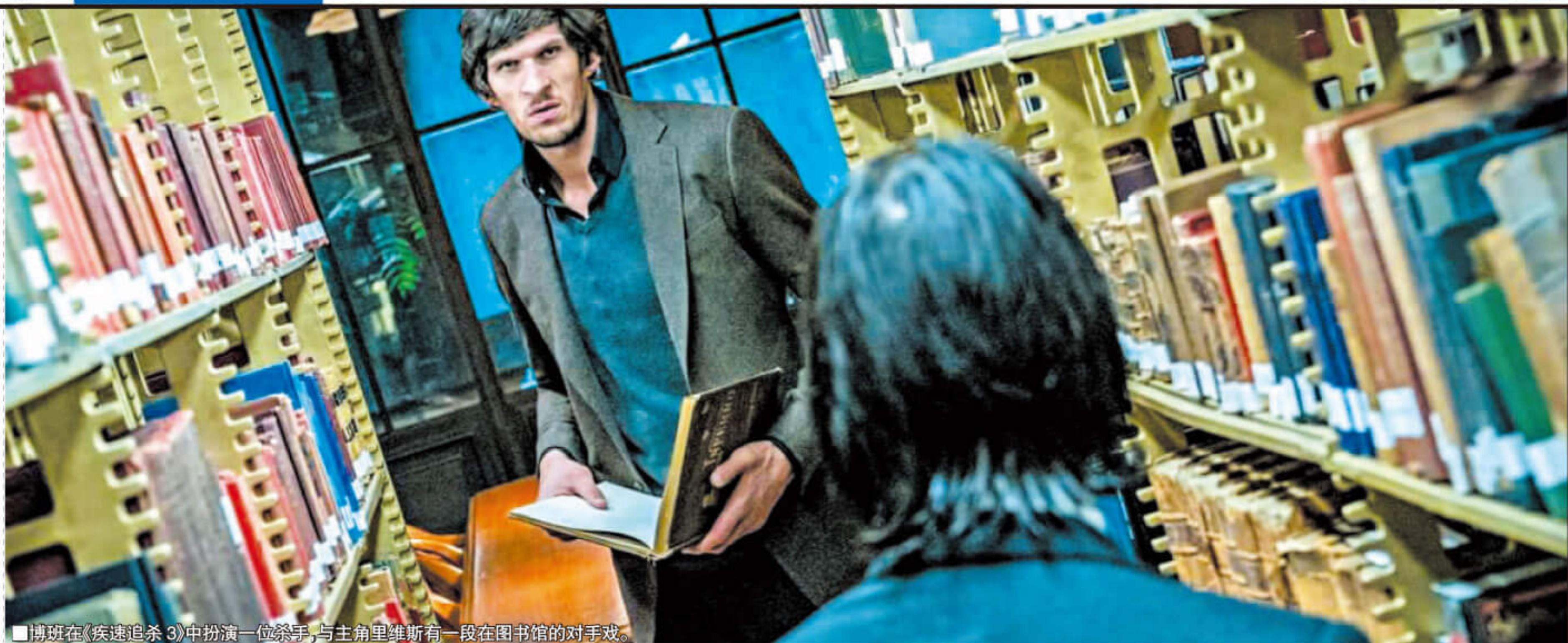
■博班在《疾速追杀3》中扮演一位杀手，与主角里维斯有一段在图书馆的对手戏。