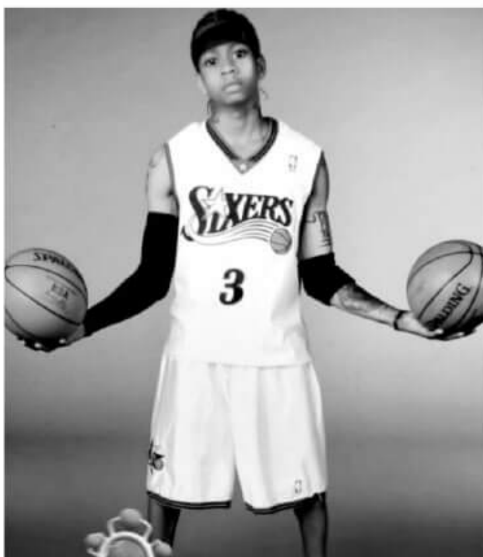
▲名宿艾弗森近日在个人社交平台上晒出了一张经过童颜滤镜处理的照片，并配文写道：“这个滤镜真的太酷了！哈哈。”