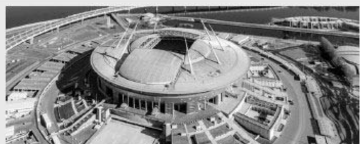
Saint Petersburg Stadium 圣彼得堡体育场