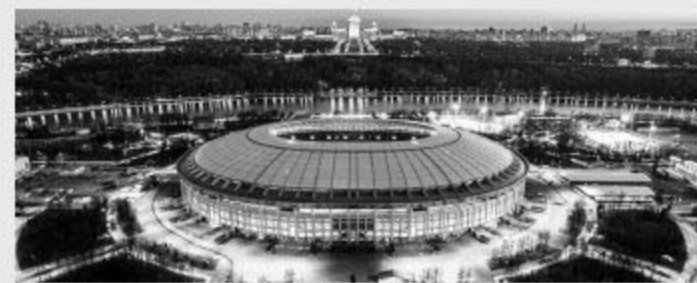
Luzhniki Stadium 卢日尼基体育场

俄罗斯 VS 埃及 巴西 VS 哥斯达黎加 尼日利亚 VS 阿根廷 16 强战、半决赛、三四名决赛