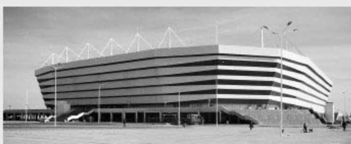
Kaliningrad Stadium 加里宁格勒体育场

俄罗斯 VS 沙特阿拉伯 德国 VS 墨西哥 葡萄牙 VS 摩洛哥 丹麦 VS 法国 16 强战、半决赛、决赛