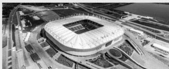
Rostov Arena 罗斯托夫竞技场

突尼斯 VS 英格兰 尼日利亚 VS 冰岛 沙特阿拉伯 VS 埃及 日本 VS 波兰