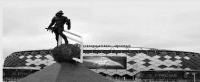
Spartak Stadium 斯巴达体育场

巴西 VS 瑞士 乌拉圭 VS 沙特阿拉伯 韩国 VS 墨西哥 冰岛 VS 克罗地亚 16 强战