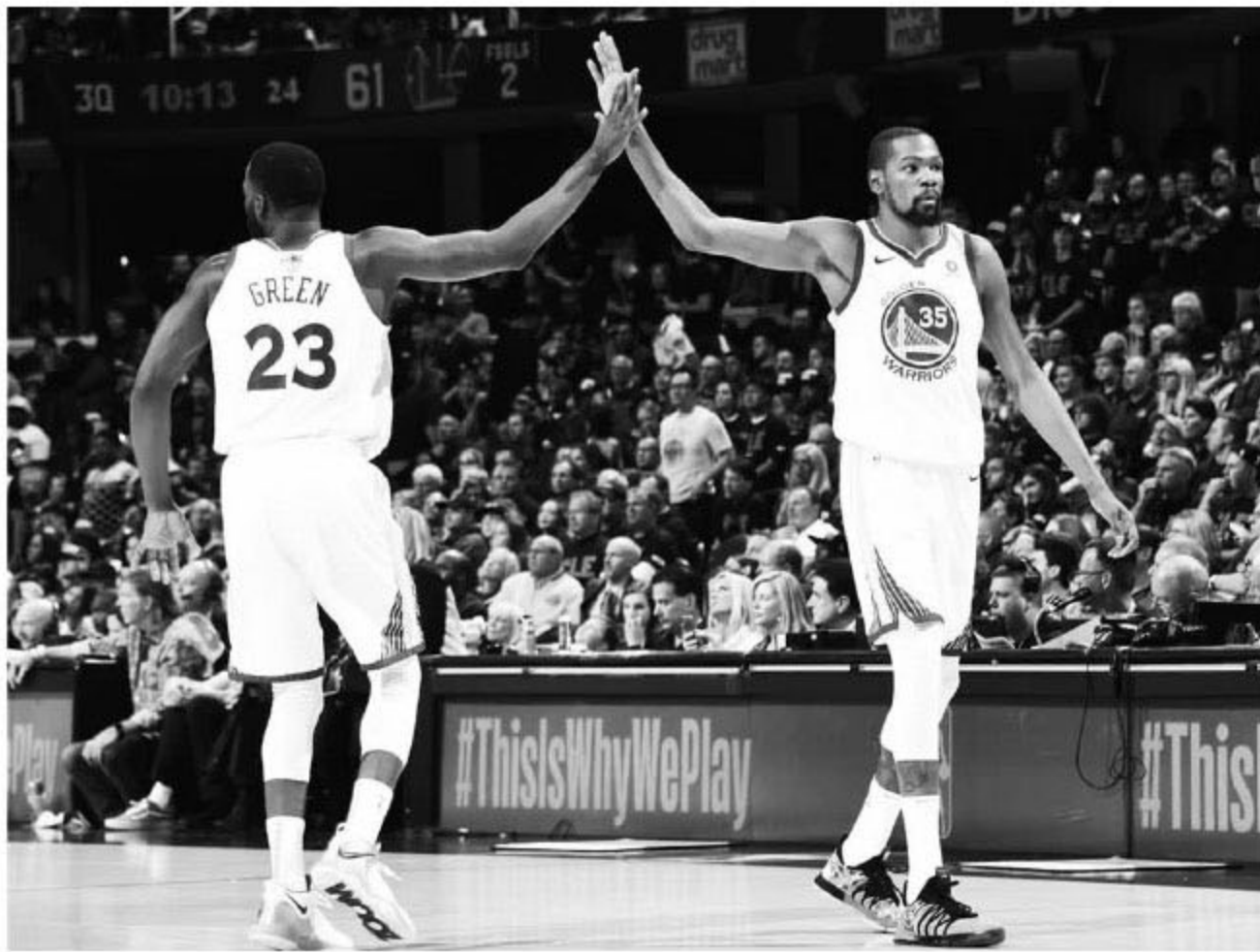
教练,我不得不说我相当奢侈。”

“我们拥有许多能够得分并填补队友空缺的球员。如果队中的某一名球员今晚状态不佳,他们总是可以互相帮助,非出困境。”勇士主教练科尔说道。“作为主