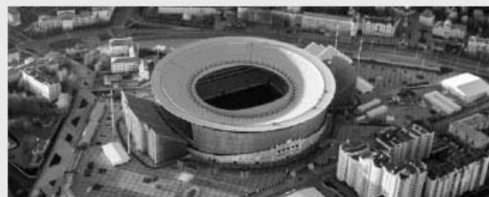
Ekaterinburg Arena 叶卡捷琳堡竞技场