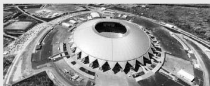
Samara Arena 萨马拉竞技场