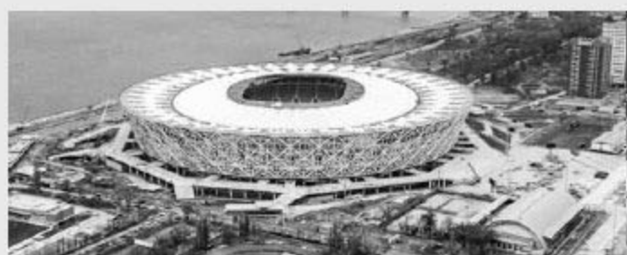
Volgograd Arena 伏尔加格勒竞技场

克罗地亚 VS 尼日利亚 塞尔维亚 VS 瑞士 西班牙 VS 摩洛哥 英格兰 VS 比利时