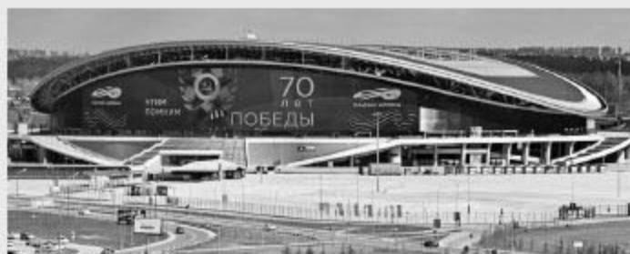
Kazan Arena 喀山竞技场