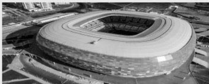
Mordovia Arena 莫尔多瓦竞技场