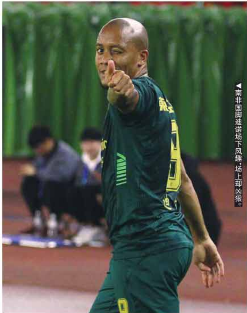
▲南非国脚迪诺场下风趣，场上却凶狠。

和上轮联赛携手拉基奇一起首发不同，迪诺知道自己需要用更多的跑动来寻找得分机会。上半场迪诺一