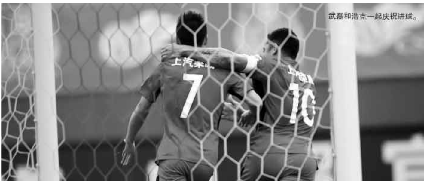
武磊和浩克一起庆祝进球。

2017赛季,广州富力面对强大的上港队成绩不俗,客场在上海攻陷八万人球场,主场与上港队打平。