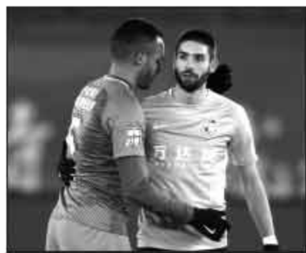
▲卡拉斯科们热盼着新帅的先进战术。

离开土耳其后又休息了两年,舒斯特尔又返回熟悉的西甲,执教马拉加,但这也同样是失败赛季,刚刚得到卡塔尔投资的马拉加仅排名第11位,未能完成赛季前制定的进入前10名的目标。2014年离开马拉加后,舒斯特尔已