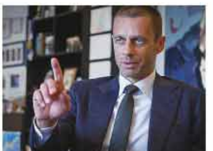
▲欧足联新任掌门切费林上任后，致力于寻求竞技体育和经济效益间的平衡。

除了德甲缺席，也是各有1队入围，最终是俄罗斯的莫斯科中央陆军夺冠。因为奖金的大幅度提升，以及冠军能够获得1个欧冠小组赛名额，欧联杯成了五大联赛的香饽饽。球迷们基本不太可能再看到2010/11赛季那