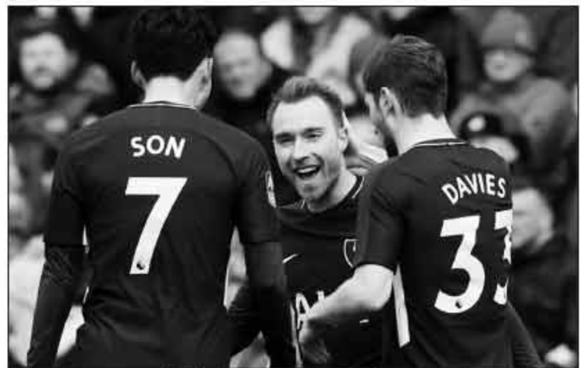
▲凯恩受伤,埃里克森将与孙兴慜担负起攻城拔寨的重任。

在波切蒂诺管理俱乐部的哲学中,联赛的重要性胜于杯赛,而冠军也只是短暂的成功,更重要的是持久的进步和表现。“赢得了某个冠军,就好像你已经完成了一项了不起的工作。不过过程才是最重要的事情,对不对?当你拿到冠军,是水到渠成的事情。然后你需要随时为下一个挑战做好准备,不然的话,所有的快乐很快就会变成悲伤。在社会上也是如此,不仅仅是足球。你需要找到不同的动力和刺激,我不是说胜利不好,我们现在做的一切,都是为了赢得冠军!”而足总杯,可能是最现实的起点。