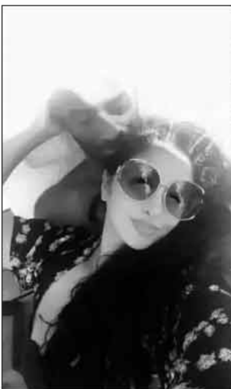
「瓦妮莎在社交媒体上晒出了一张与科比度假的亲密合影。马特·巴恩斯评论道：「这是准备和科比再生一个儿子吗?」瓦妮莎回复：「瓦妮莎在社交媒体上晒出了一张与科比度假的亲密合影。马特·」