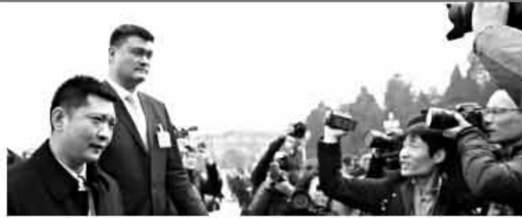
3月3日,中国人民政治协商会议第十三届全国委员会第一次会议在北京人民大会堂开幕,中国篮协主席姚明在会场外成为记者围堵的焦点。