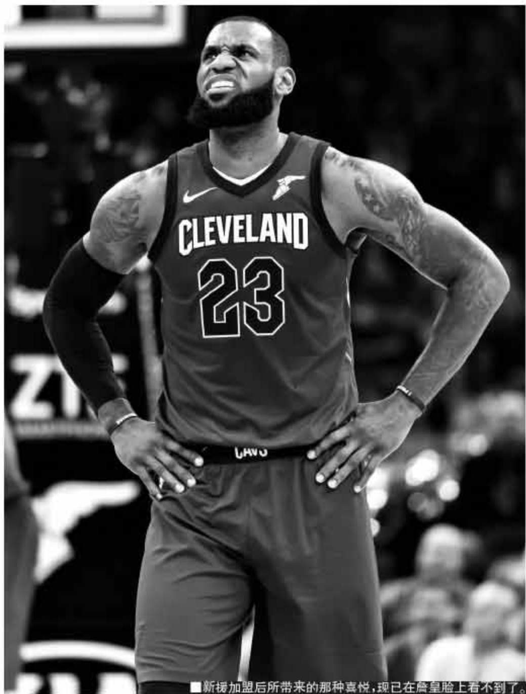
■新援加盟后所带来的那种喜悦，现已在詹皇脸上看不到了。

泰伦·卢没办法，骑士只能等勒夫复出。他回归后，又要和新来的球员进行一番磨合。骑士根本没时间去等待，勒夫一上场就得真刀真枪去拼。现在已经是“疯狂3月”，等到4月如果还没起色，骑士就真的得为进季后赛而担心了。