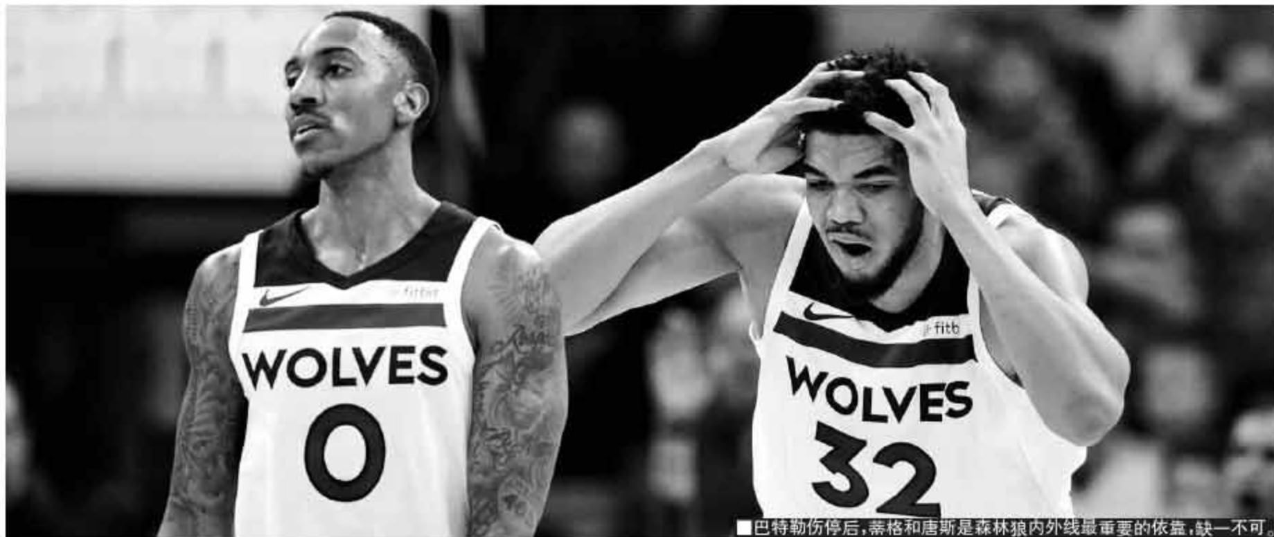
■巴特勒伤停后,蒂格和唐斯是森林狼内外线最重要的依靠,缺一不可。