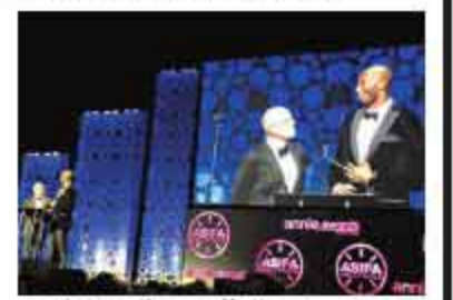
▲科比此前已经收获安妮奖。