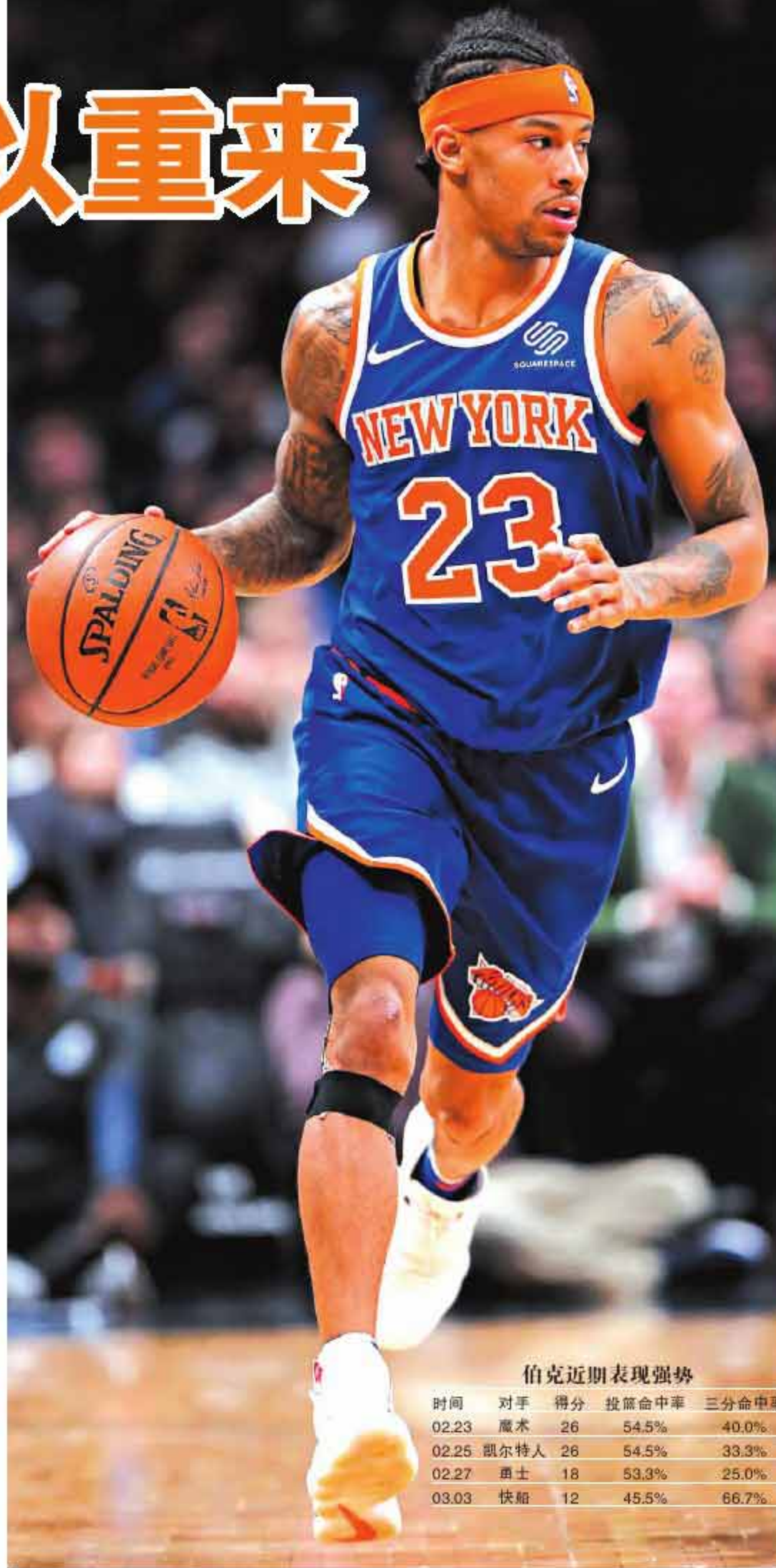
伯克近期表现强势