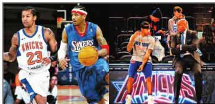
▲伯克的长相、身材甚至神态,都和艾弗森极为相似。

霍纳塞克承认,在波尔津吉斯赛季报销后,比起争取上场,目前球队更倾向于锻炼年轻球员,“球队当前的目标是继续尽全力打球,并给年轻人一些上场时间。”得益于此,伯克得到了更多的机会,而他也正在把握这次良机。