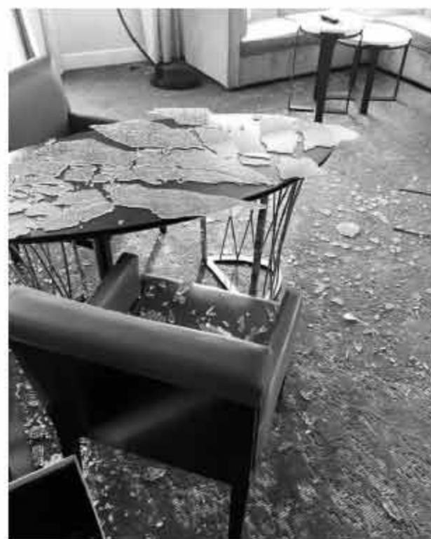
「练习一下挥杆动作。」 「玻璃碎片，并写道：「当你觉得自己要打PGA巡回赛时，你得在酒店V库里在酒店练习高尔夫挥杆不慎打碎了玻璃，他晒出满地的玻」