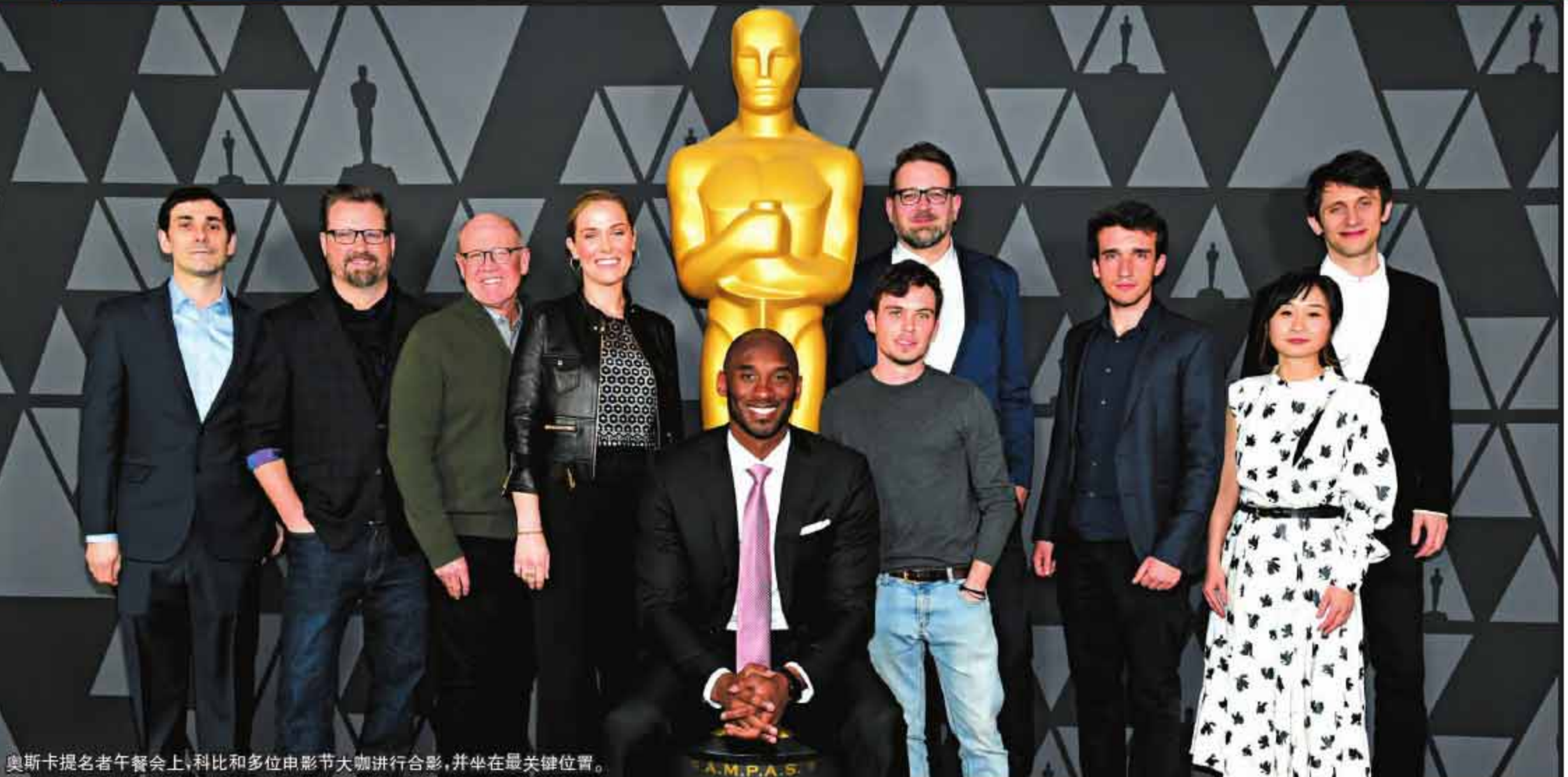
奥斯卡提名者午餐会上,科比和多位电影节大咖进行合影,并坐在最关键位置。