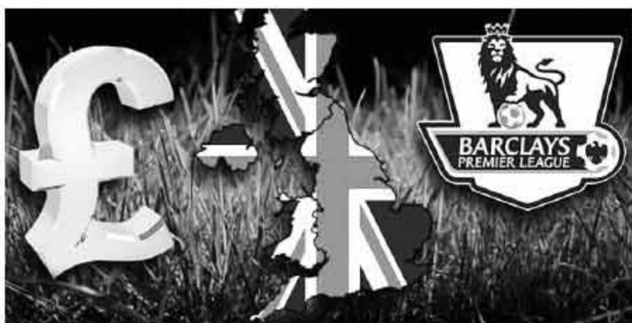
杀,他们之间的相互交锋,以及和第二军团争夺的战斗交织在一起,会成为本赛季英超赛季最大看点之一。