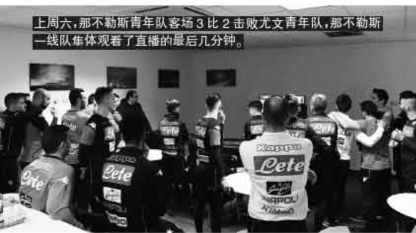
上周六，那不勒斯青年队客场3比2击败尤文青年队，那不勒斯一线队集体观看了直播的最后几分钟。

4月22日两队还要直接交锋，尤文主场。尤文新球场2011年落成使用以来，联赛只输4次，每年不到1次，凶手依次是国米、桑普、乌迪内斯，本赛季上半程的拉齐奥，用尽了本赛季主场输球的份额还会再犯错吗？