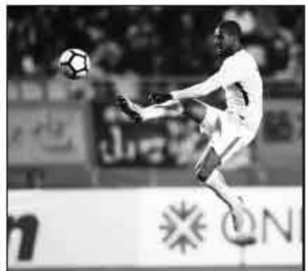
▲阿兰急需找到状态。

直没有跟队合练。我认为我的表现是可以接受的，当然了，还有上升的空间，这个就通过以后的训练和比赛慢慢去提升。从体能上来讲，我还是可以打满90分钟的，但就像主教练说的那样，如果继续踢下去确实有可能增加受伤的风险，我们现在最重要的是调整好状态，准备下一场比赛。”