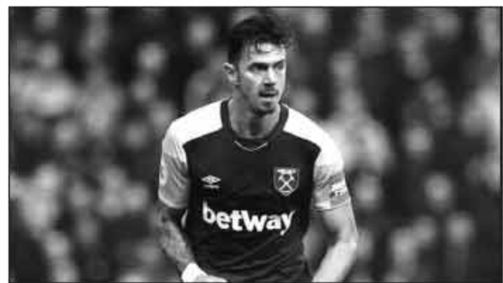
▲冯特先于卡拉斯科加盟大连队。

员加盟中超的提问。对他来说,这在现在已经不是稀奇事。与卡拉斯科不同,周中对本哈根杯的欧冠杯打满全场的托雷斯,进入了周末对塞维利亚的大名单。来自西班牙的消息,原本托雷斯并不愿意考虑此时离开,因为他还想为自己在马竞的岁月留下唯一的奖杯作为纪念。但大连的报价着实诱人,除了1000万欧元的转会费,还有税后1500万欧元的天价年薪,是他在马竞年薪的5倍。这也是托雷斯职业生涯最后的大合同,很难抉择。大连方面给托雷斯和他的经纪人留下的时间同样不多,周一老金童就要给出明确的答复。留下,有望给自己在马竞的职业生涯留下最为看重的奖杯;离开,则可以像10年前一样,为母队带来最现实的帮助。