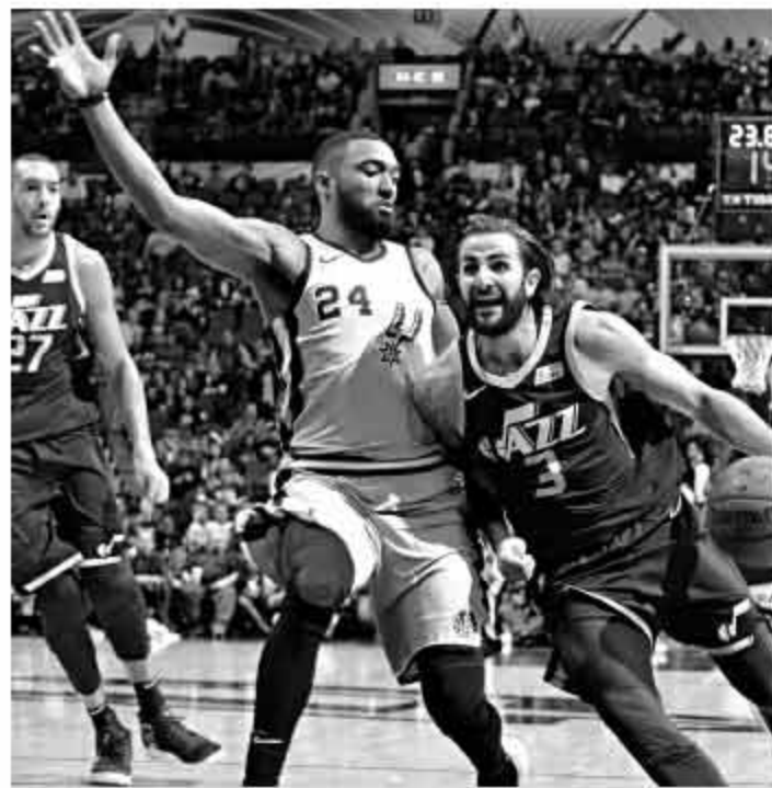
爵士五连胜期间表现出色

除了这场比赛被马刺得到111分以外，其他四场爵士都没有让对手的得分超过100分，尤其是猛龙和勇士，分别只得到了93分和99分。要知道这两支都是联盟顶级的进攻强队，到目前为止勇士场均得到115.6分高居联盟第一，