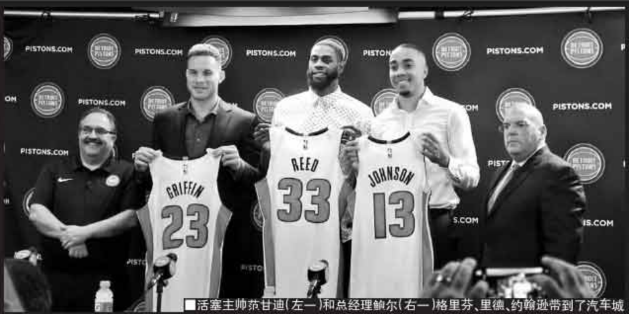
活塞主帅范甘迪(左一)和总经理鲍尔(右一)格里芬、里德、约翰逊带到了汽车城

格里芬的转会打破了中期交易市场的平静。交易无非出于三种考虑：重建、补强和腾出薪金空间，多支球队也为了各自的目的积极运作，诸多实力派球员更是“待字闺中”。如今距离交易截止日2月8日(美国时间)只剩几天，很可能会继续出现重磅的交易，大家拭目以待。