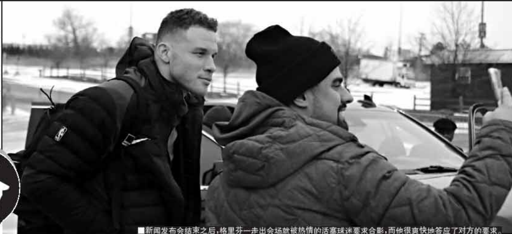
■新闻发布会结束之后，格里芬一走出会场就被热情的活塞球迷要求合影，而他很爽快地答应了对方的要求。