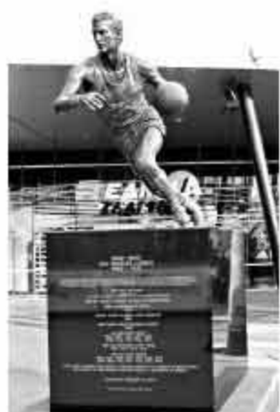
▲韦斯特在斯台普斯中心外拥有自己的铜像。

去年夏天,韦斯特主动示好老东家仍没有得到回应,这让他有些心灰意冷。在快船上任后,这位“湖人教父”也改了口,他称即使湖人跟他联系,他也不会回归。“绝对不可能,我跟湖人队已经没有联系了。老实说,就算他们跟我联系了,我也不会回去的。我们没有过任何的对话,而我对重返湖人也不存在任何的渴望,我知道那是不可能发生的事情。”韦斯特说。