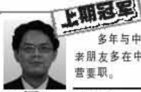
上期冠军 正军师 上期盈亏: +1000分 单期冠军: 5期