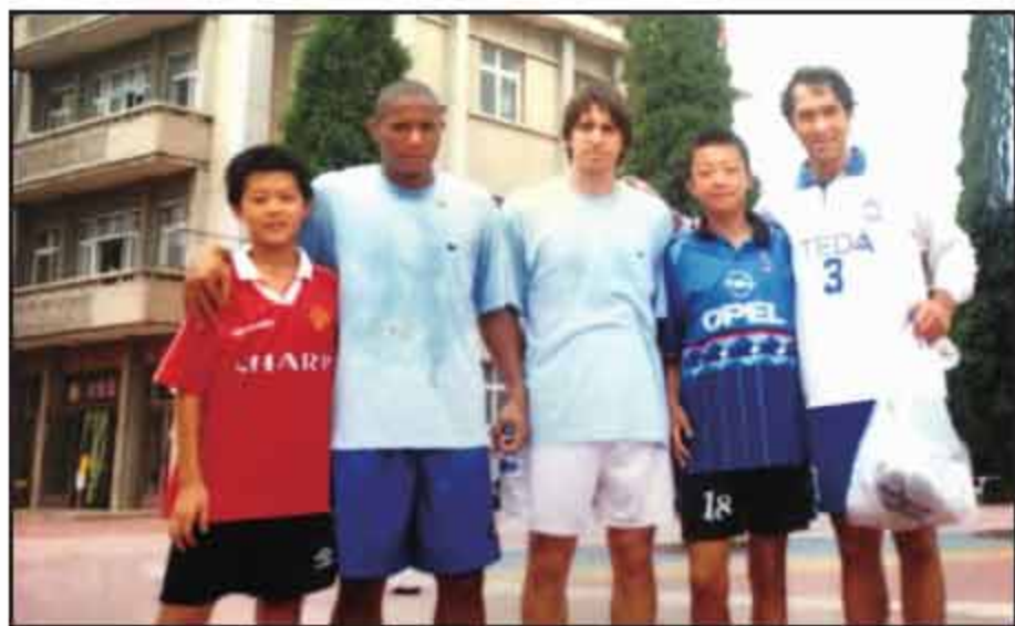
▲在中国足协,有机会接触来这里集训的职业球队。

“未来继续留在恒大,继续留在广州,希望能取得更多的冠军。30岁了,如果说有什么愿望的话,那就是希望跟以前一样,一切都顺顺利利,家人身体健康,平平安安。想感谢的人很多,尤其是那些在我成长过程中帮助过我的人。”