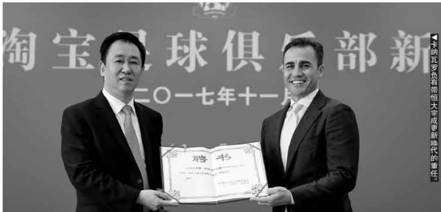
卡纳瓦罗负有带领恒大完成更新换代的重任。