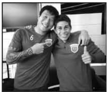
他有望再披绿色战袍。莫雷诺曾在国民竞技效力3年,现在,

对上港来说,附加赛过关问题应该不大,前两个赛季,他们都是轻松过关,新赛季,他们的目标依旧是冠军。