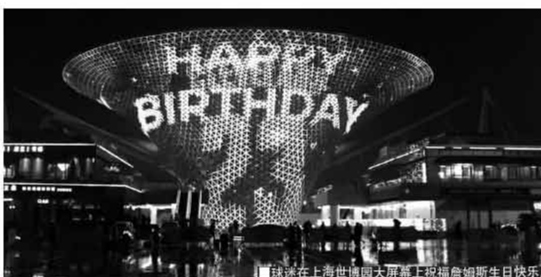
球迷在上海世博园大屏幕上祝福詹姆斯生日快乐。