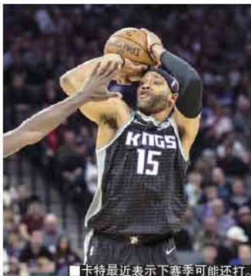
卡特最近表示下赛季可能还打。

此前卡特已经歇了三场，因为肋骨有些老伤，而在伤好后，主帅也让他休息。这一场让他复出，原本也没抱太大希望，只是想让他走走。卡特不小心就创下了一项纪录，在此之前，NBA从来没有一个40岁的替补球员能得20分以上。“今天投篮很顺，但全靠队友们的传球，而球总能到空位。”卡特没有得意忘形，“这球看起来也有趣。如果我们能一直保持这种状态，那将是一支不错的球队。”