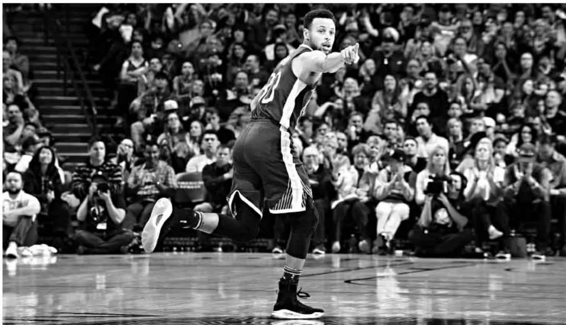
缺席 11 场比赛的库里,在复出首战便打出一场历史级别的表演,也让勇士找回了久违的统治力,为 2017 年完美收官。