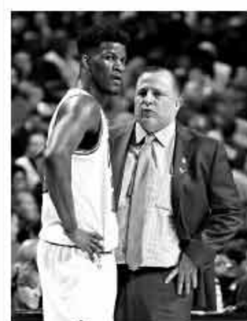
▲早在公牛时期巴特勒就已经适应了锡伯杜的执教风格。

不过有意思的是,当初被公牛选中之后,巴特勒花了很长一段时间才适应锡伯杜的执教风格,当然锡伯杜对他的态度也有了极大的转变。巴特勒在接受采访时说:“我不想撒谎:最初的时候我无法忍受他,我从来不会用‘憎恨’这样的词汇,但那个时候的确是那样,我非常努力,但他始终不给我上场机会,后来我的出场时间渐渐多了,我告诉自己要继续下去,现在他已经是我生活中重要的一部分。”