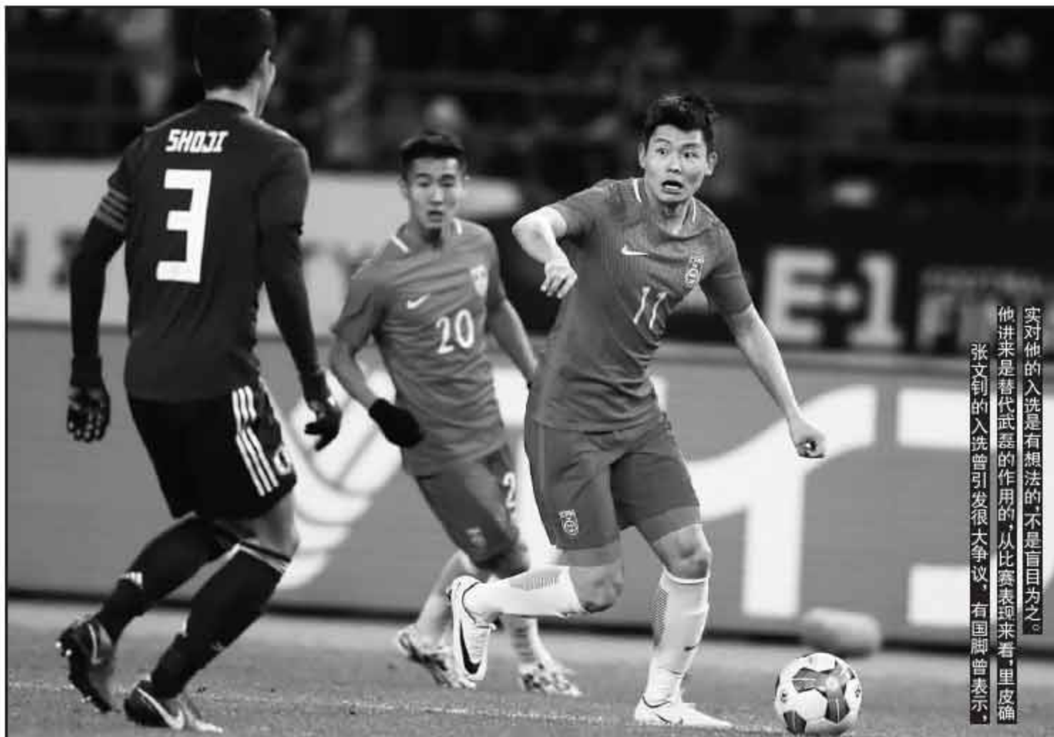
他对他的入选是有想法的，不是盲目为之。张文钊的入选曾引发很大争议，有国脚曾表示，他进来是替代武磊的作用的，从比赛表现来看，里皮确实

日本队出场阵容(451)： 东口顺昭/山本修斗、昌子源、三浦弦太、植田直通/仓田秋、大岛僚太(30'井手口阳介)、土居圣真(82'阿部浩之)、今野泰幸、伊东纯也(75'川又坚基)/小林悠