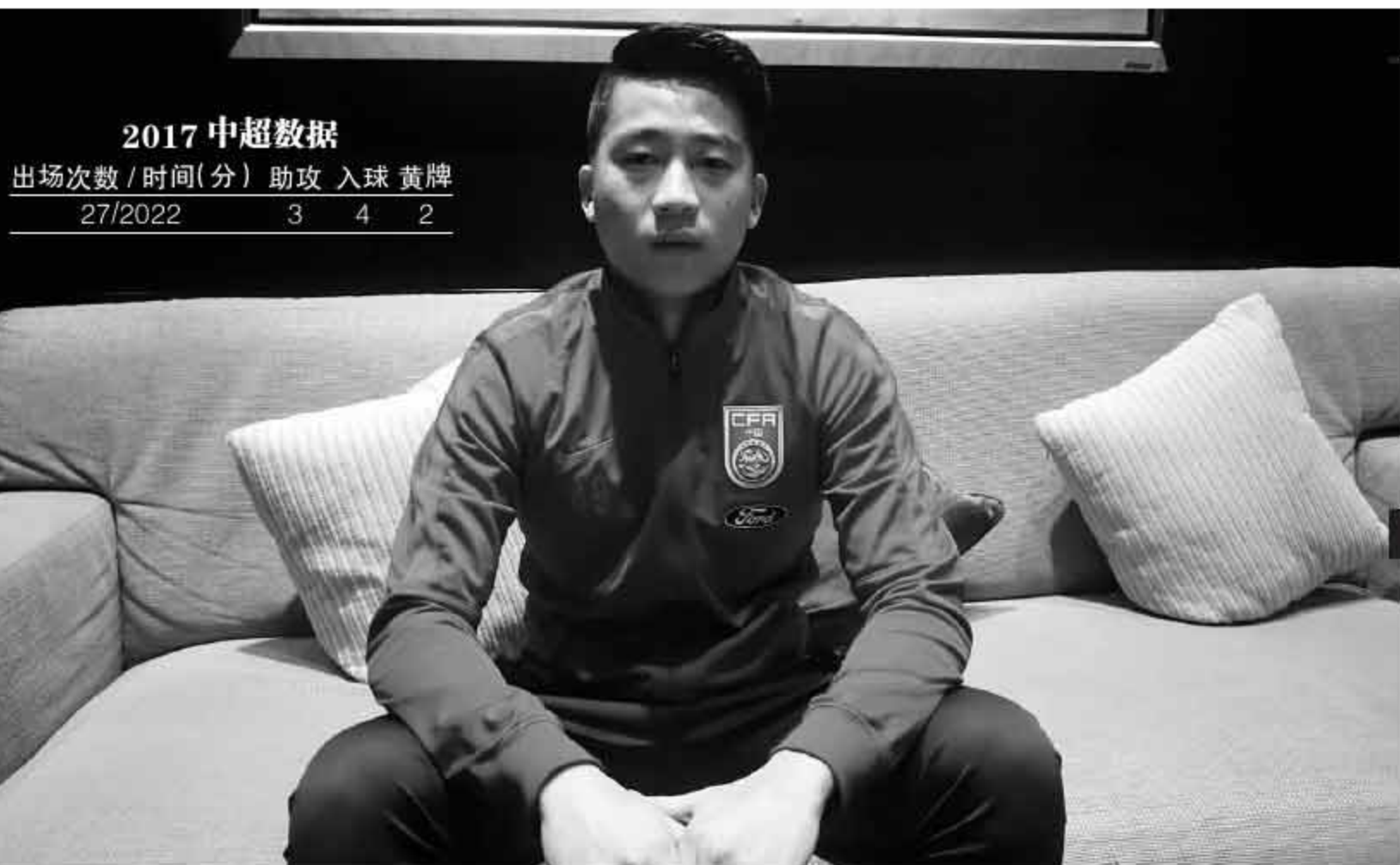
2017 中超数据 出场次数 / 时间(分) 助攻 入球 黄牌 27/2022 3 4 2