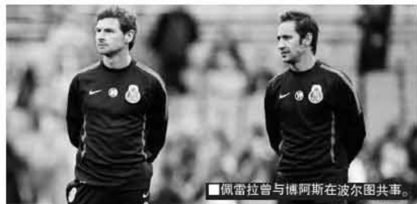
佩雷拉曾与博阿斯在波尔图共事。