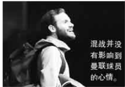
混战并没有影响到曼联球员的心情。

曾在日本执教的教授还说:“我不知道(曼市德比赛后)真正发生了什么。在日本时我喜欢看相扑。看相扑,你永远看不出谁赢了。相扑手胜利后会隐藏喜悦,向对手鞠躬致敬,这说明尊重对手的文化在那儿扎根之深。英超能拷贝吗?我不认为,这儿的足球文化没这一块。”