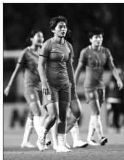
▲打日本战术上值得检讨。

冰岛人已经用先进的战术理念和训练方式赢得了球员的认可。但做的当务之急，是将这些外界所不了解的，早现到比赛当中，去赢得更多的认可和更多的时间。