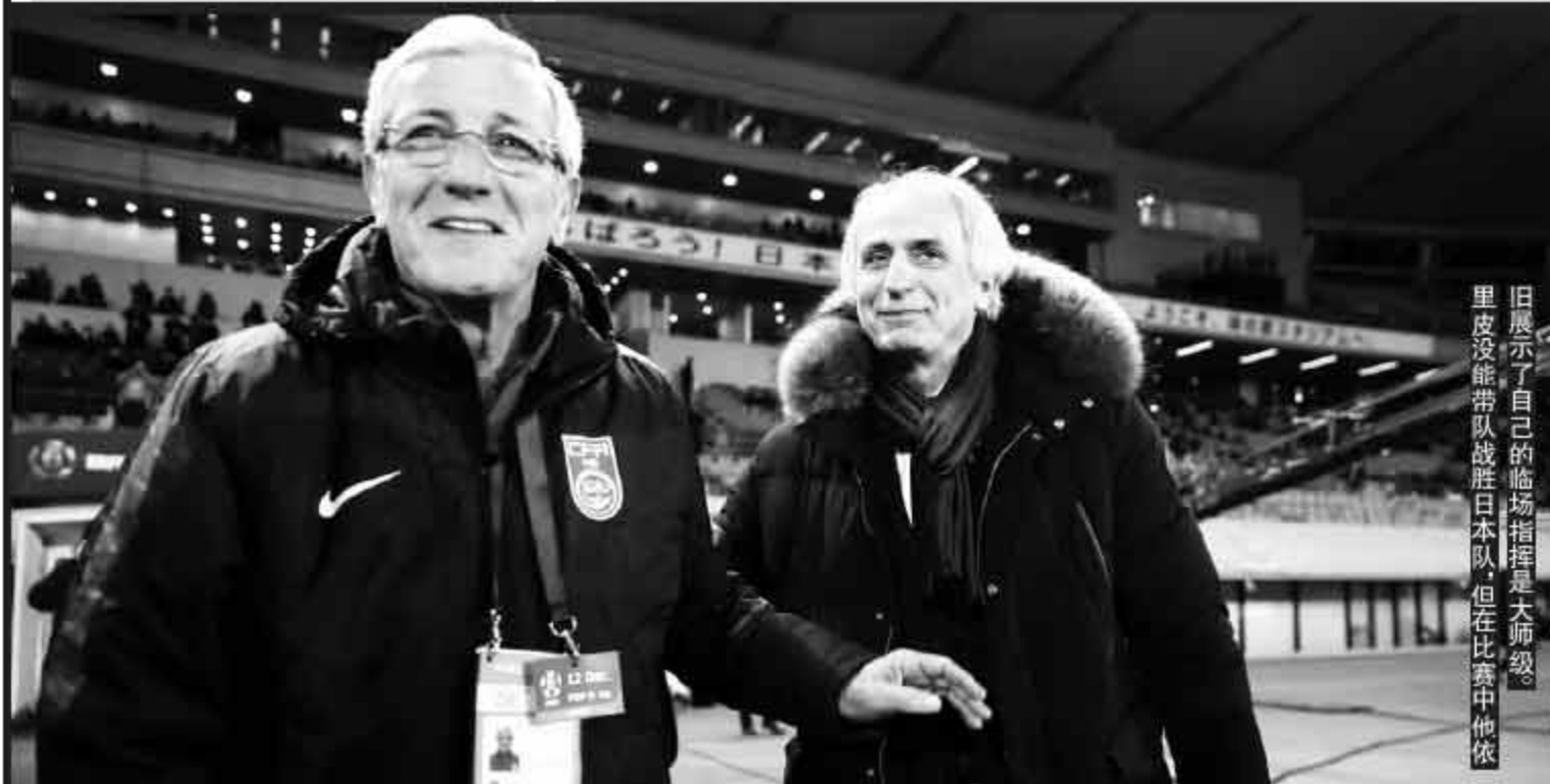
旧展示了自己的临场指挥是大师级。里皮没能带队战胜日本队，但在比赛中他依