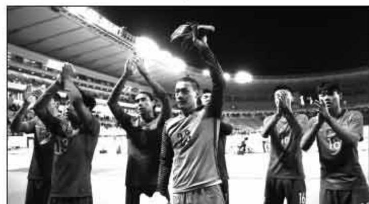
▲1比2在最后关头输给日本队，球员们还是难掩失落，但大家还是来到场边，感谢远征的球员。

但是，即便在这个方面，里皮也不是全能，一是改变需要过程，二是改变总有上限，我们欣喜地看到了过程的展开，却无奈于上限确实并不高。