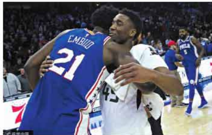
▲虽然被恩比德摆了一道,但是比赛结束后两人还是互相拥抱,在这方面米切尔也要向恩比德学习。

事实上米切尔在试训的时候就表示自己乐于防守,他说:“许多球员都能连续投篮25或者30个球,但你能防守吗?这是一个巨大的考验,这也是我喜欢竞争的原因,因为我想证明,我的进攻和防守都很优秀。”后来他也宣称自己的目标是讲入最佳防守一阵。但在此之前他应该要多多汲取经验,学会在比赛中保持冷静,如果他依然这么冲动,成为联盟顶尖的防守人不过是一句空话。