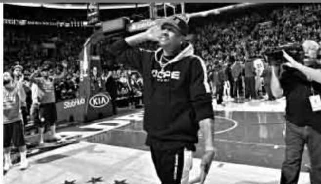
北京时间12月3日,76人主场对阵活塞的比赛前,球队专门给艾弗森安排了一个亮相时间,“答案”走到球场中央向观众致意,并做出经典的庆祝动作,将费城球迷带回那个充满激情的年代。