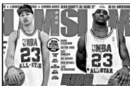
▲西蒙斯复制詹姆斯经典造型,但他俩的体格相差甚远。

此外西蒙斯的投篮区域比起詹姆斯来说还是偏窄,ESPN 的专家表示:“如果西蒙斯能够像勒布朗那样练好外线中远距离的投篮,或许他还有一定可能成为接班人。”虽然西蒙斯的投篮命中率高达50.3%,但他的三分球至今还没开胡(8中0),罚球也只有55.9%,跟詹姆斯相比还是有很大的差距,这也是他需要优先强化的技能。