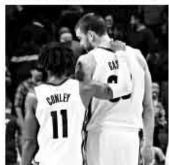
▲灰熊选择保留这对组合,但他俩加上帕森斯就占据了很大一块薪金空间。

考虑到灰熊糟糕的选秀眼光,倒不如指望华莱士再次在交易市场上化腐朽为神奇。当年他用大加从湖人交易到小加的签约权,和兰多夫组建了“黑白双熊”,并且因此让球队成为西部的重要力量。虽然这个时代对小球市没那么友好,但奇迹未必不能再来一遍。