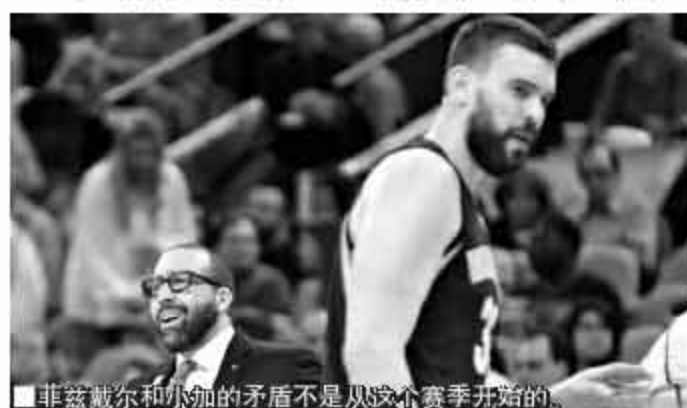
菲兹戴尔和小加的矛盾不是从这个赛季开始的。

霍林斯的继任者乔格尔也是非常不错的主教练,他努力地帮助灰熊维持着西部强队的身份。然而媒体爆料称乔格尔始终没能得到小加和康利的支持,被迫主动提出辞职,后被国王邀请出任主教练。如今菲兹戴尔在执教了一个多赛季之后又被扫地出门,虽然不太确定是否和小加有直接关系,但看起来小加就是所有主教练的噩梦。(彭凯俊)