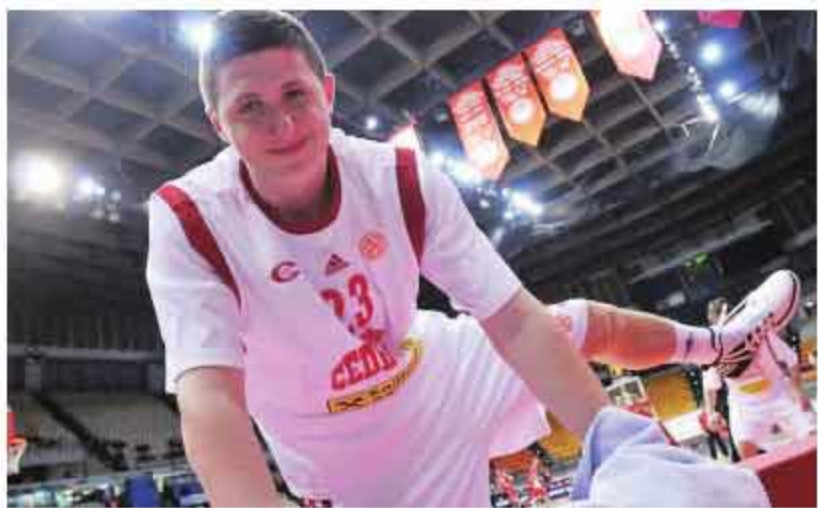
▲在塞德里茨效力的努尔基奇一脸稚气。