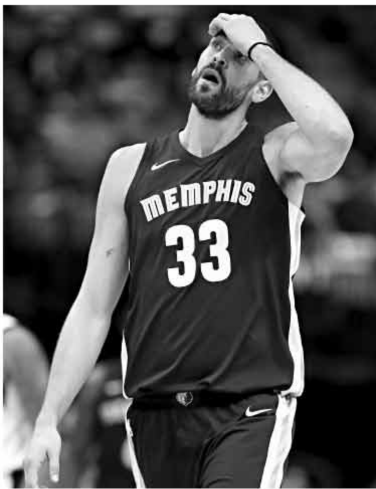
灰熊本赛季状态非常差

当然,灰熊现在的外境很不妙,他们解决问题的方法并不多,如果无法找回过去很多个赛季的坚韧精神的话,这支球队将会继续往深渊滑下去。