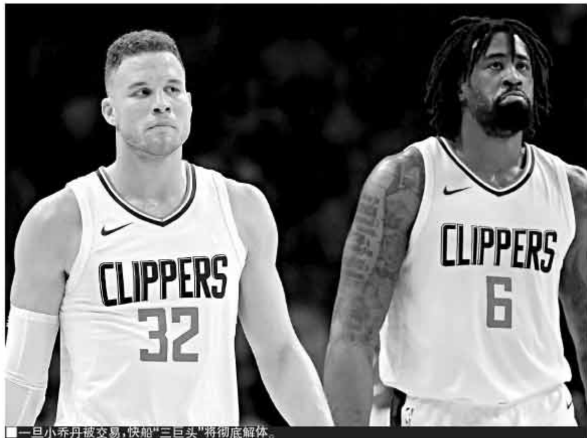
一旦小乔丹被交易,快船“三巨头”将彻底解体。