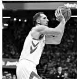
▲保罗的传球让安德森的三分命中率暴涨。

如果安德森能在保罗的帮助下继续保持如此强悍的三分投射能力,那么他在火箭的位置就稳如泰山。虽然3年7230万美元的合同看起来依然是个大数目,但有保罗加成的安德森无疑值这个价格,或许他很快就能让质疑声消失殆尽了。