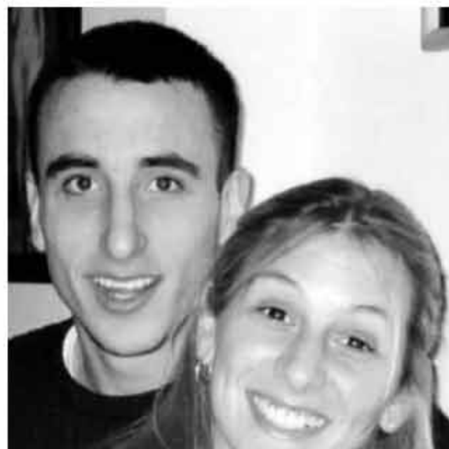
>> 吉诺比利晒出了自己与妻子年轻时的合影，庆祝两人相识 20 周年纪念日。“和这位女士在一起的前 20 年真的是太美妙了！我还要更多的时间！”马努写道。