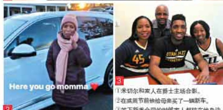
1 米切尔和家人在爵士主场合影。