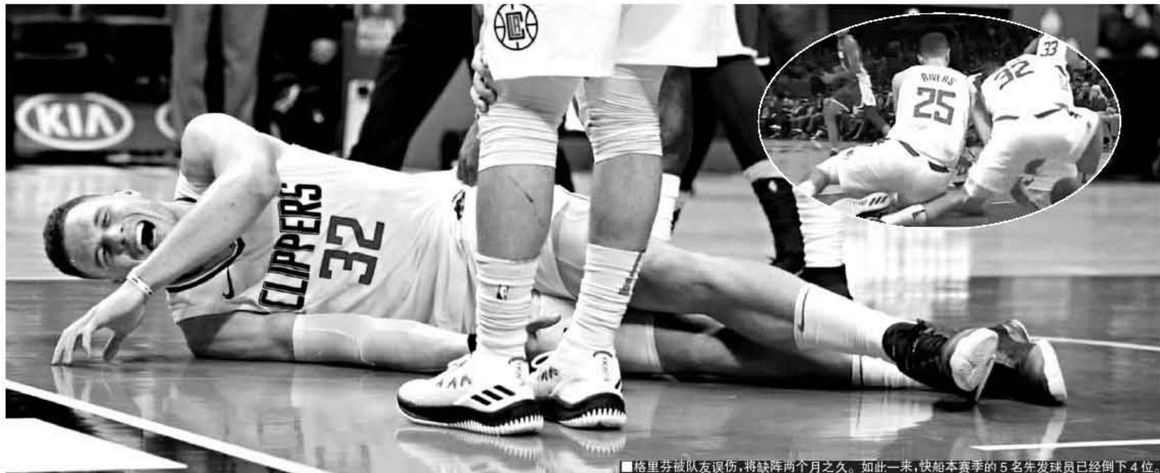
■格里芬被队友误伤,将缺阵两个月之久。如此一来,快船本赛季的5名先发球员已经倒下4位。

后保罗时代的快船打出一波不俗开局,但接连不断的伤病击倒了他们的4名主力球员,目前只有缺乏自主进攻能力的小乔丹保持健康。接下来没有格里芬的两个半月里,缺兵少将的快船将迎来残酷的赛程,球队管理层还坐得住吗?