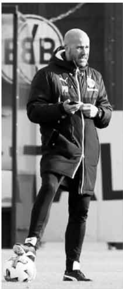
记者艾文报道 矿区德比的4比4

有多么大的影响,多特蒙德主帅博斯和他的球队在周日晚上有了更明确的感受。俱乐部的会员大会上,博斯和球员受邀出席,听到球迷们刺耳的嘘声,博斯只能尴尬的走到了座位上。球迷的嘘声是针对矿区德比的,也是在质疑博斯是否有能力令球队扭转局面。