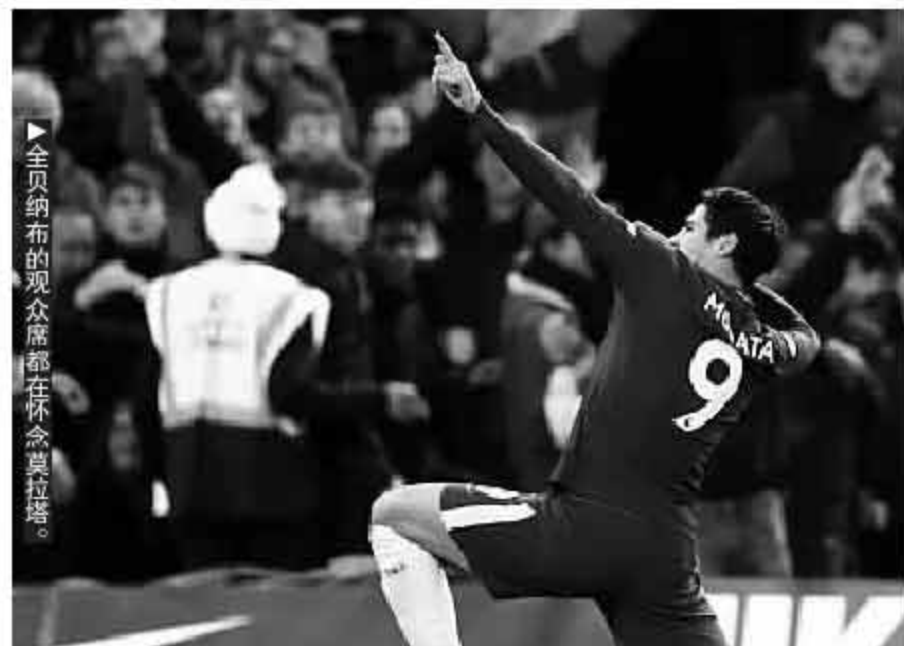
▲ 全员纳布的观众席都在怀念莫拉塔。

齐达内没有在锋线引援,只是留用了巴斯克斯、阿森西奥和马约拉尔,但他们的出场时间并未像上赛季那样得到稳定的保证。这其中,马约拉尔首当其冲,皇马的替补前锋在西甲前11轮一共才得到了108分钟,其中只有1次首发,虽然获得了进球,仍然无法赢得齐达内的信任,其余5场比赛替补登场只有对贝蒂斯时超过了10分钟,还有5次只能枯坐板凳。联赛出场数据比起上赛季的马尼亚诺,也就是略好,与莫拉塔相比差距过千倍大——莫拉塔上赛季前11轮全部出场,5次首发,6次替补出场时间全部超过10分钟,合计出场535分钟,是马约拉尔的5倍,数据是4球3助攻,帮助皇马取胜塞维利亚、毕尔巴鄂竞技、阿拉维斯和莱加内斯,有效地保证了皇马同期8胜3平的成绩。