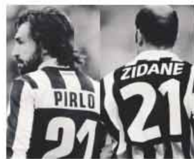
■齐达内在社交账号上贴出此图并配大师一词。

在米兰的10年时间,皮尔洛两夺欧冠,从一名中场新星成长为全欧洲的传奇型中场核心,超一流球星。回首特拉帕托尼带队国家的失败,重要一点便是锁着他的4231不放,坚