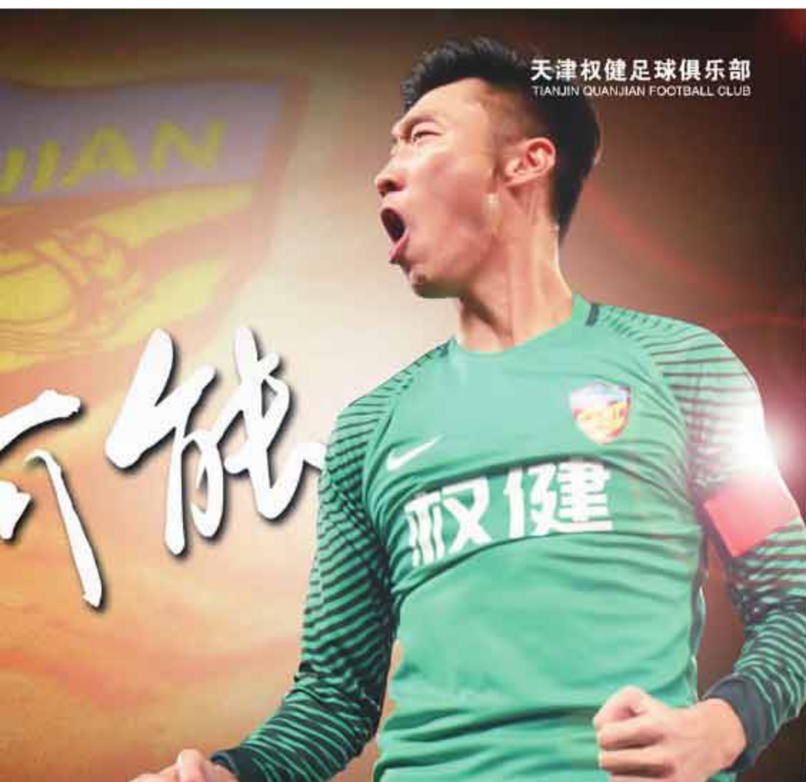
天津权健足球俱乐部 TIANJIN QUANJIAN FOOTBALL CLUB