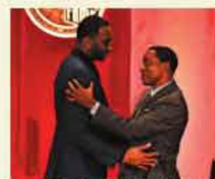
▲以赛亚·托马斯当年选中了麦迪,同时也是他的名人堂介绍人。

马菲特·迈克格劳:圣母大学女篮主帅,三度当选全美最佳大学教练创历史纪录,2001年率队夺冠。