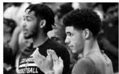
▲新赛季英格拉姆在球队中的地位还将迎来鲍尔的挑战。

势,杜兰特在雷霆队时期的助理教练布莱恩·基弗给了他一定的指导。如今,英格拉姆出手时手肘更靠内,这样能改变出手点。“我一直在苦练投篮,现在感觉更舒服了,从外线出手时我感觉更自信了,我感觉自己已经准备好在外线把球投中。”英格拉姆近日接受采访时说,“上个赛季我自己的表现并不理想,特别是在投射方面,我给大家的印象并不好。因此我在夏天更加注意在这个方面练习,我希望能够在新赛季改掉之前的‘不好的印象’。”