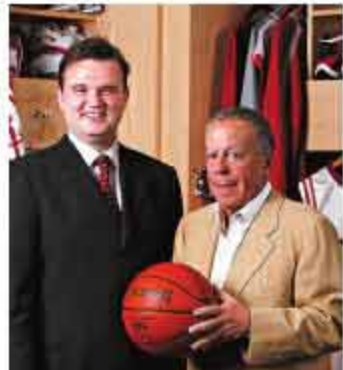
▲亚历山大的慧眼识人使得火箭成为联盟当中数据分析的先行者。

在亚历山大宣布出售球队时,联盟总裁萧华给予了他极高的赞誉:“亚历山大是个有着竞争意识的人,他创造了优秀的文化,有着优秀的管理团队,吸引名人堂成员、全明星球员和优秀的教练团队。他在联盟范围内备受尊重,他是个积极、具有影响力的老板,用自己的眼光让篮球运动在全世界范围内发展,尤其是在中国。”