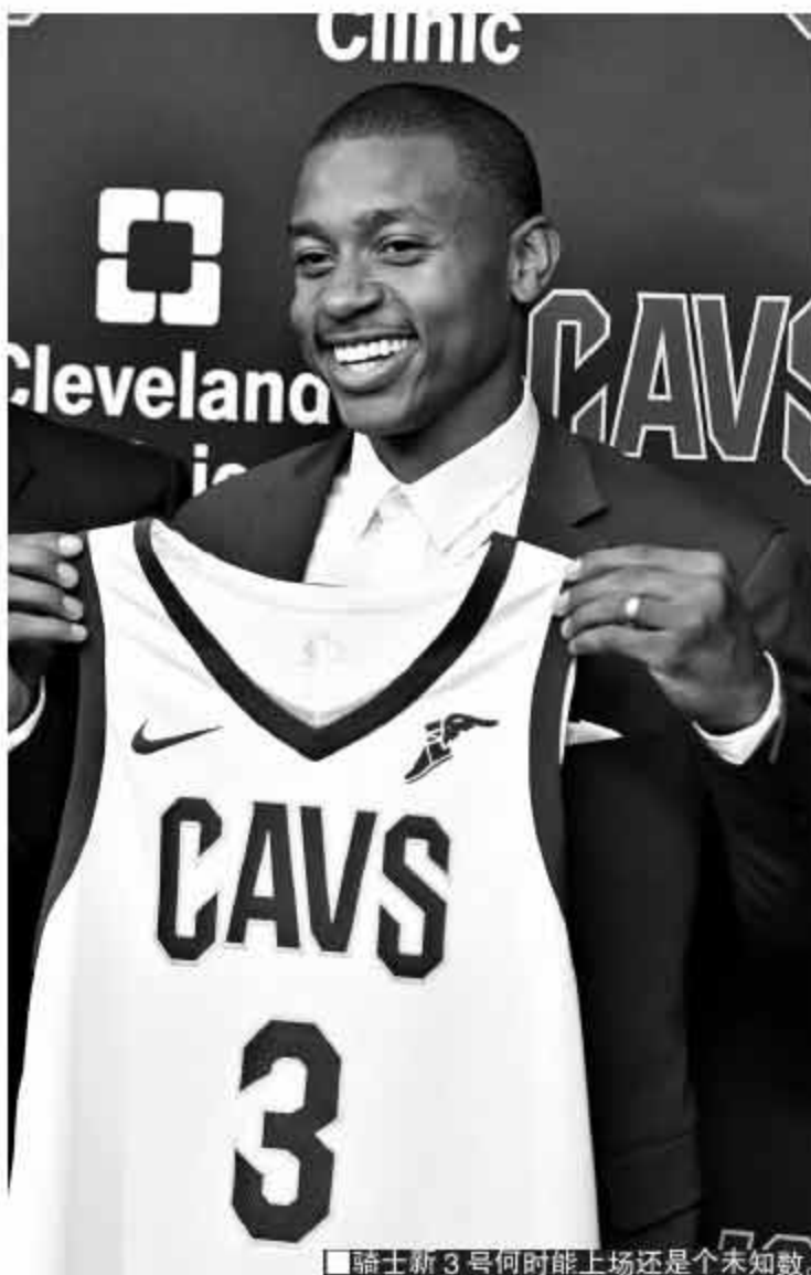
▲骑士新3号何时能上场还是个未知数。