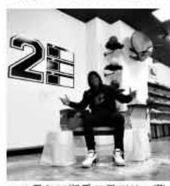
▲这是詹姆斯乐于见到的一幕。