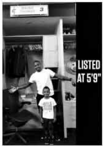
▲小托马斯的身高被无情标注。

值得注意的是，有美国媒体放出消息称小托马斯之前之所以选择不做手术，是因为他已经和臀部斗争多年，他已经找到了应对的办法，并且可以一直让自己保持高水准。但必须要清楚的是，这并不是说他没问题，他的伤病是真实存在的，并且当前仍然还在康复的过程中，究竟何时能痊愈归来，可能就只有小托马斯自己的心里才最有数。