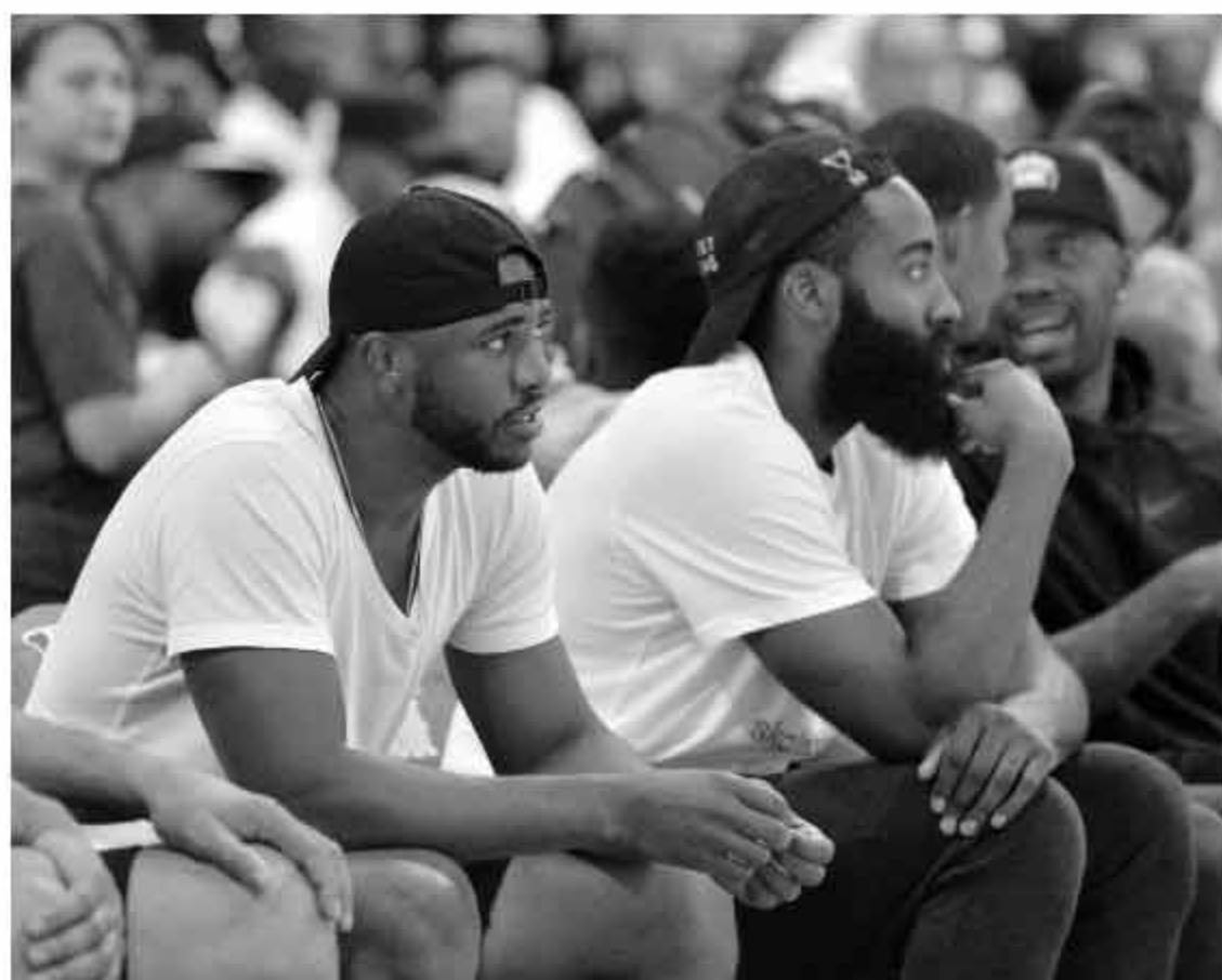
▲未来费尔蒂塔可能会因为保罗和哈登而缴纳高额奢侈税，但这也是他不能不做的事情。

认，他说：“亚历山大出售球队并不会影响他对追求安东尼的看法。同时，出售球队也不会影响到火箭找到足够的筹码来完成这笔交易的可能性。”当然，作为