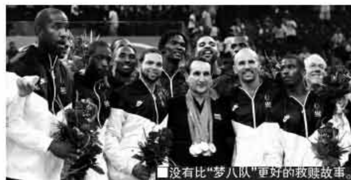
■没有比“梦八队”更好的救赎故事。

对手一样，2004 年雅典奥运会男篮半决赛，美国碰到了阿根廷，只不过结局相反，美国男篮输了。那是美国从 1992 年成立“梦之队”以来，唯一的一届没有在奥运会赛场上夺得金牌，即使他们拥有了邓肯、艾弗森、詹姆斯等众多 NBA 球员。