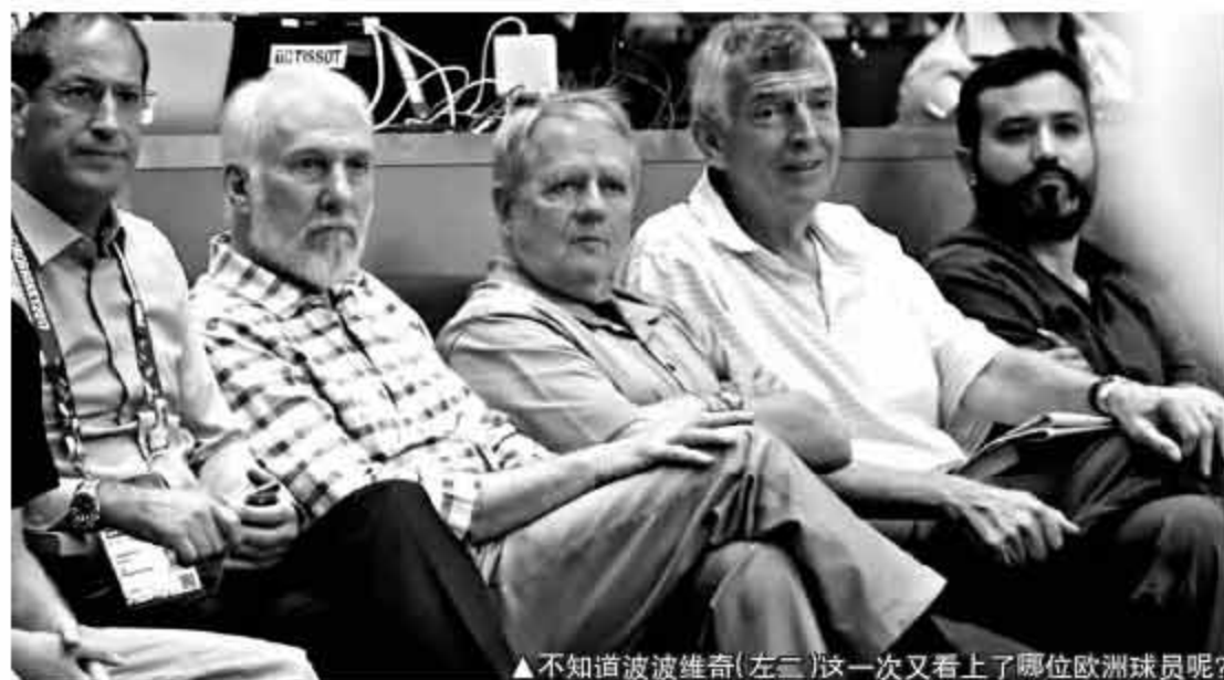
▲不知道波波维奇(左三)这一次又看上了哪位欧洲球员呢?

在八月份斯洛文尼亚同克罗地亚的一场热身赛中，东契奇全场得到了 27 分、8 个篮板和 5 次助攻，赛后对方的主教练是这样评价东契奇的。“他打球的方式太令人震撼了。”克罗地亚主帅彼得诺维奇说道，“这些年来卢卡（东契奇）的表现让我觉得，欧洲已经很久没有出现过像他这样完美的球员了，无论是球技还是心理，像他这样极具天赋的球员似乎已经有 10 年甚至 15 年都没有出现过了。”