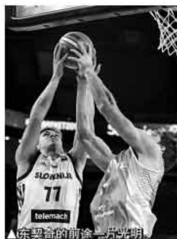
东契奇的前途一片光明。

1999 年出生的东契奇现在只有 18 岁，身高 2.01 米。但他其实在 13 岁时已经声名远播。东契奇早年在斯洛文尼亚的奥林匹亚联盟俱乐部的少年队训练，2012 年 4 月 U13 巡回赛罗马站的一场比赛中，他砍下了 54 分 11 个篮板和 10 次助攻的大号三双，率领球队赢球的同时自己也当选了 MVP。也正是在这场比赛后，他被西班牙皇家马德里俱乐部看中，同年 9 月份，年仅 13 岁的东契奇就被皇马招致麾下，他当时跟皇马签下了一份为期 5 年的合同。