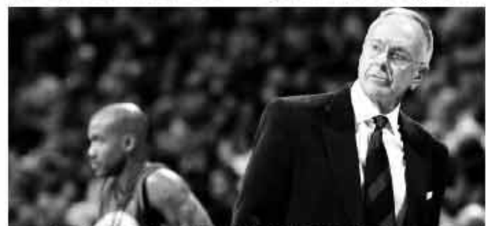
▲马布里与拉里·布朗之间一直存在着很大的矛盾。