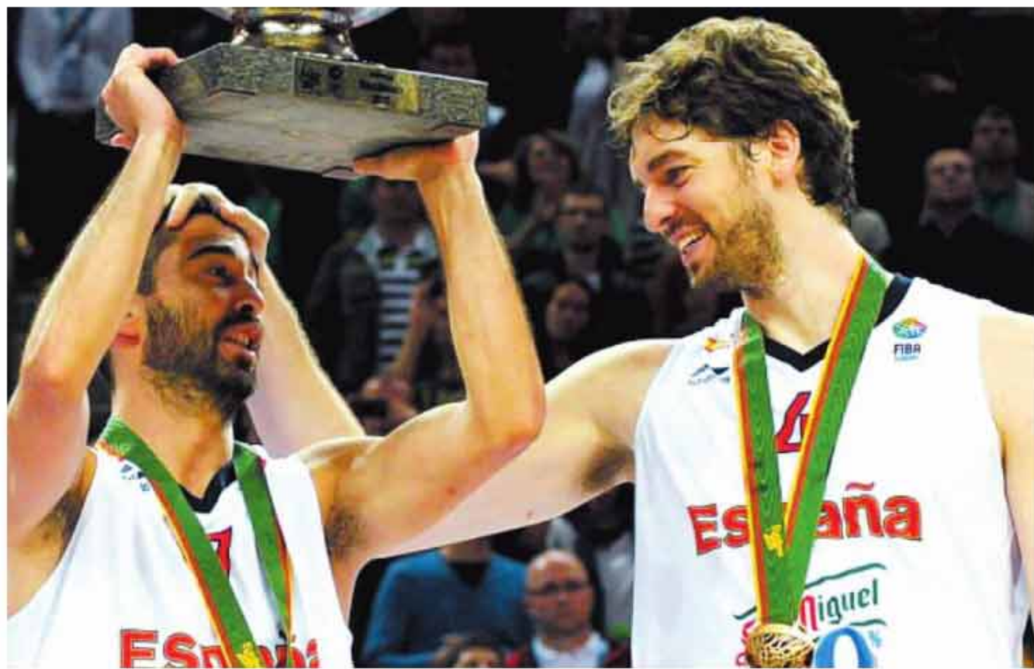
从第1分到第1111分,加索尔用16年的时间加冕欧洲杯历史得分王,而这16年里,纳瓦罗是唯一的见证人。他们是彼此一生中最好的朋友,“炸弹”甚至戏称他们是“孪生兄弟”。