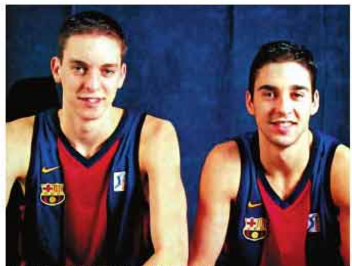
▲加索尔和纳瓦罗都出自巴萨青年队。

落叶归根是一件美好的事,如果能和自己的好兄弟在出道的球队共同退役,也算有始有终。