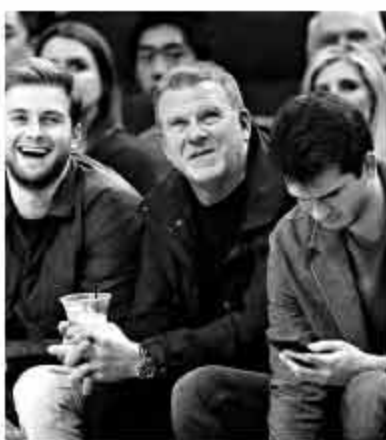
▲费尔蒂塔在丰田中心观众席前排有自己的固定位置。

很多专家都认为费尔蒂塔和库班有相似之处，很大程度上是因为两者都是疯狂的球迷。虽然费尔蒂塔是一个精明且富有魅力的老板，但不可否认，他对休斯敦这座城市和火箭这支球队的热爱也是他这次溢价收购的重要原因。