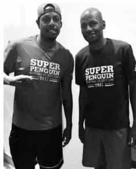
带永远不断。他写道：「我们之间都有一种特殊的纽带，并呼吁加内特和隆多能够和好。」是时重归于好，V·皮尔斯日前上传了一张自己和雷·阿伦的合影。