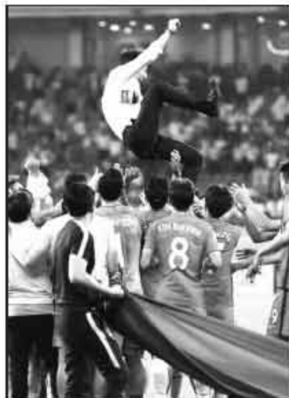
▲韩国打平以小组第二晋级,居然如此狂欢庆祝!

至于在40强赛曾一鸣惊人的泰国,讲入12强赛后立刻暴露了实力的巨大差距,也是12支球队之中唯一没有胜绩的。朝鲜队在40强赛意外翻船,导致了泰国这个亚洲区的鱼腩出线,但从朝鲜在亚洲杯预选赛同期的表现来看,这支总令人意外的球队,表现同样不尽人意。整个东亚地区的格局,未来可能走向日本独大,韩国和澳大利亚统治力严重下降,而中国、朝鲜和泰国根本无力挑战日本的“一超多强”格局。至于乌兹别克斯坦,虽然这次世界杯预选赛落选,杰帕罗夫等多位老将退出,实力同样也将有进一步的下滑。只要看看乌兹别克斯坦球队在亚冠近年的表现即可明晰,除非中亚白狼能将更多新人送入俄超等高水平联赛,未来将很难向亚洲第一集团发起冲击,甚至还可能失去亚洲第二集团的地位。