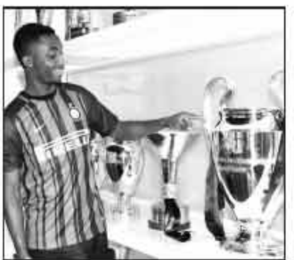
国米今夏的最后一签是 19 岁的法国妖人卡拉莫。

意甲首轮,米兰和天空台主播、布丰女友达米科吵架后,俱乐部官网用视频方式晒出几个数据:从艾利奥