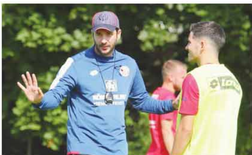
■美因茨的前主教练克洛普、图赫尔、施密特和现任的施瓦茨都是从U19升上来的,而施瓦茨肯定不是最后一个。

当前的转会市场上,年轻的德国教练很受欢迎,他们在合同谈判中外干有利的地位。给图赫尔当经