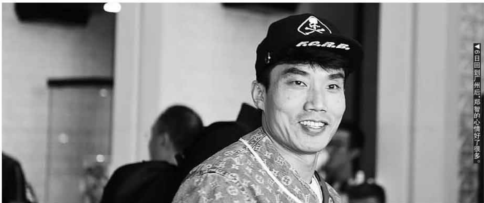
6日回到广州后,郑智的心情好了很多。