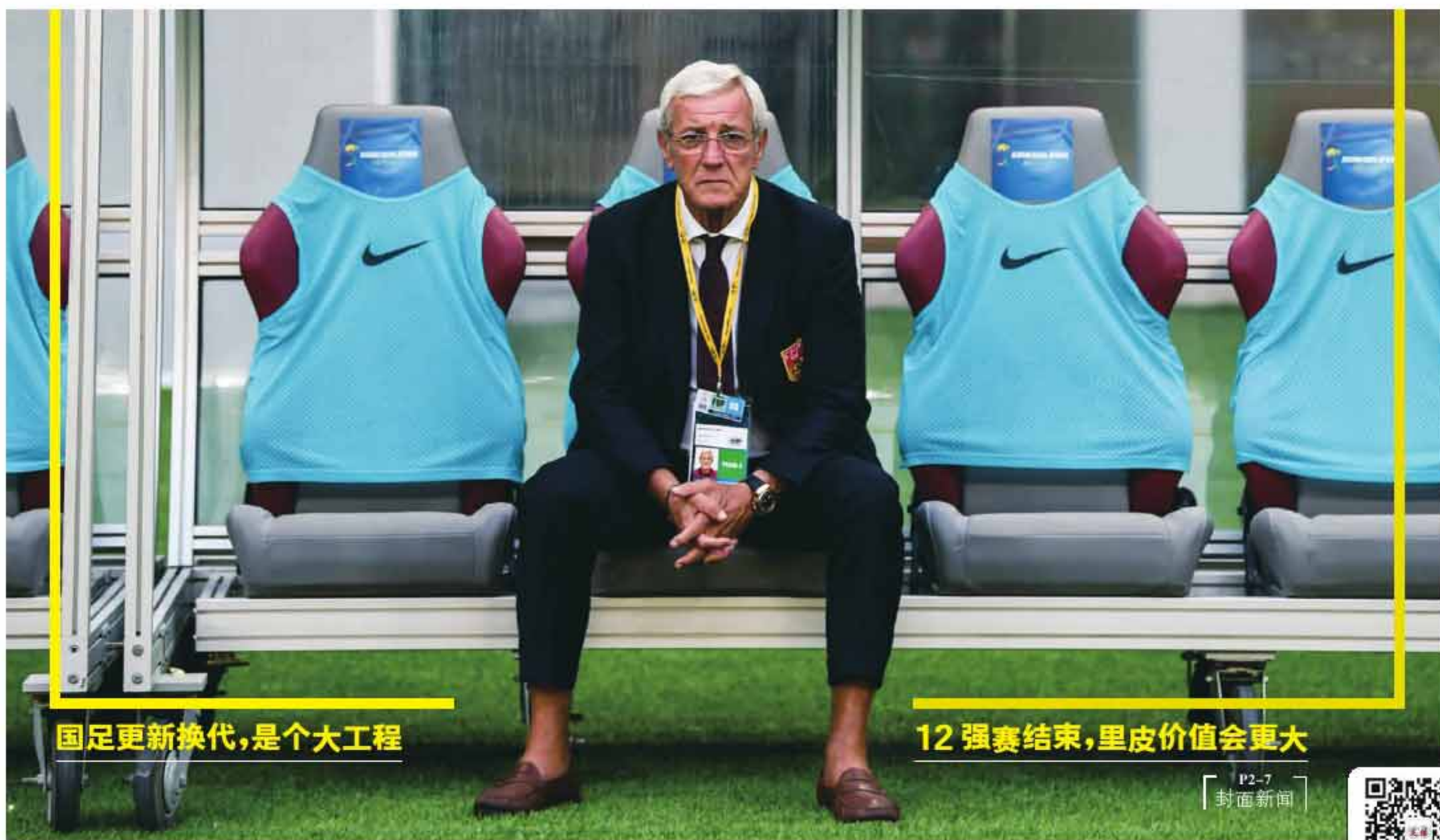
国足更新换代,是个大工程