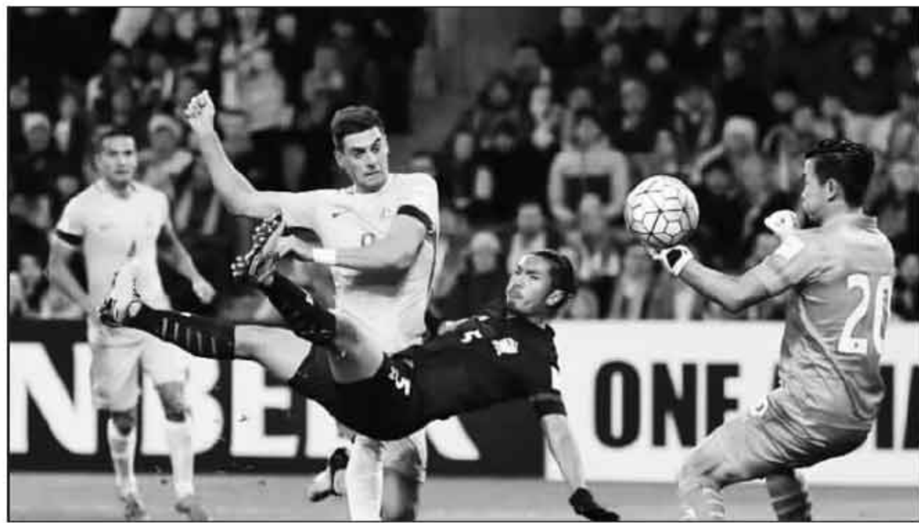
▲澳大利亚2比1小胜泰国,只能以小组第3参加亚洲区的附加赛。

记者寒冰报道 连续8次世界杯出线的亚洲老大韩国队直到最后一刻险些无法出线,连续参加3届世界杯、亚洲杯卫冕冠军澳大利亚只能位列第3名参加附加赛,世界排名长期名列亚洲第2的日本队出线之旅也是如履薄冰,另一支东亚劲旅朝鲜干脆连12强都没进入……相反,40强赛抽签时世界排名仅名列亚洲第11位的沙特阿拉伯跃上龙门,继2006年德国世界杯之后再度打入了世界杯,与此同时,叙利亚成为连续第3支参加亚洲区附加赛的西亚球队,稳定地保持着西亚足球在世界杯预选赛的表现。