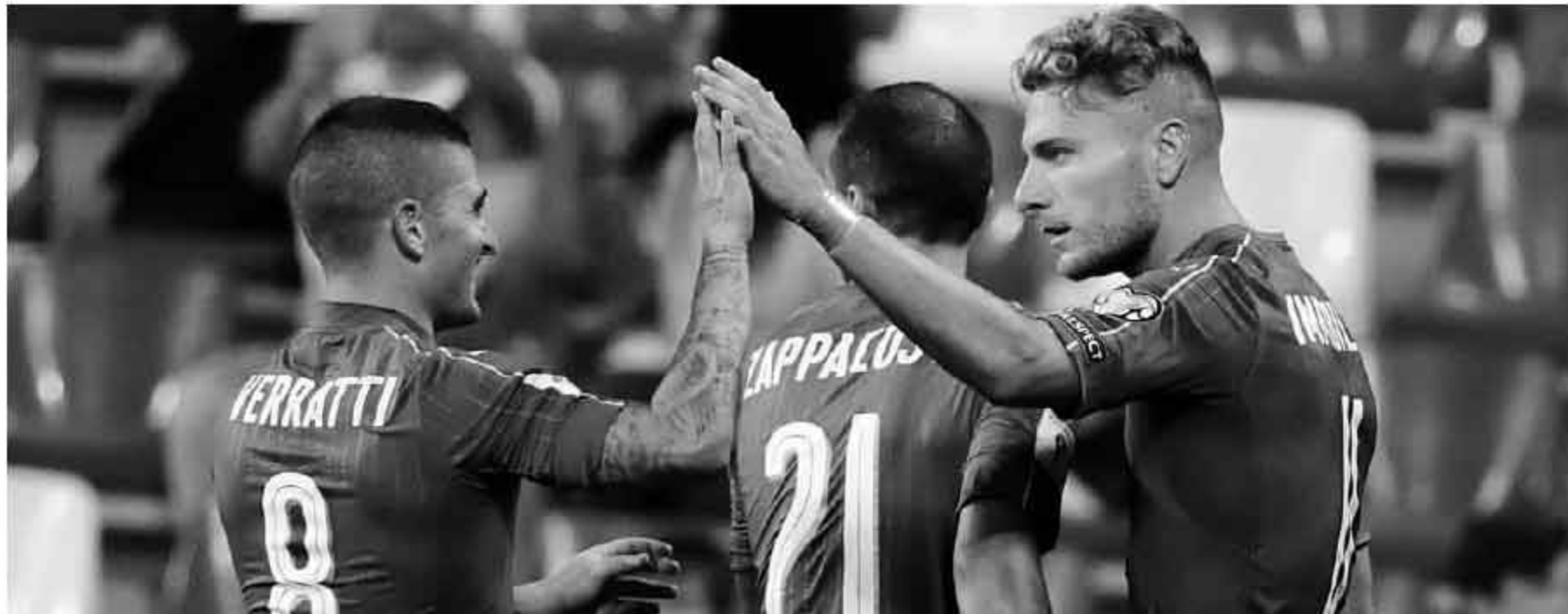
因西涅：我被用成左后卫；拉伊奥拉：文图拉在打排球