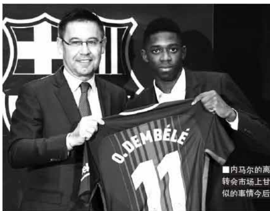
内马尔的离开让巴萨不得不在转会市场上甘愿当“冤大头”。类似的事情今后应该不会少。

因大巴黎今夏的强势，牵制西超的力量多了一股。按敌人的敌人是朋友的套路，英超自然乐意看到巴黎从巴萨自马口边挖人。多家联赛，多股力量投入欧洲顶级俱乐部角力阵营，已在改变竞争格局，也必将导致未来一段时间内欧足坛上层的实力分布。