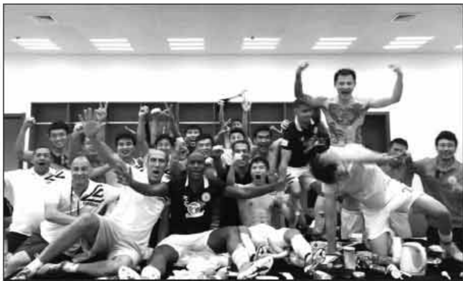
▲在大连获胜后的人和更衣室。2比0北控、4比1毅腾、3比0黄海、2比0一方,人和凭借一波凶猛的四连胜,领先第三名的永昌7分之多,进一步巩固了冲超有利位置。

特约记者唐晓报道 “这3分对一方不重要,对我们非常重要!”赛后,人和队中的一名大连籍球员兴奋地对记者说,“今年基本上就是咱们两个队上中超了!”