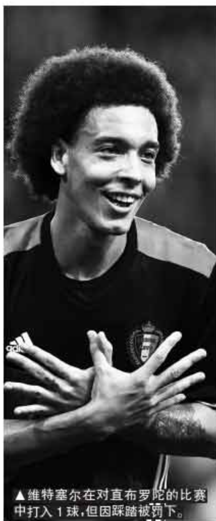
▲维特塞尔在对直布罗陀的比赛中打入1球,但因踩踏被罚下。

比赛,帮助匈牙利3比1取胜,目前以10分列B组第3,和第2名的葡萄牙有8分的差距,理论上依旧有机会拿到小组第2,3日,他们主场对葡萄牙,截至本报截稿时,比赛尚未开始。