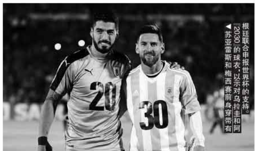
根廷联合申报世界杯的支持。 2030的球衣,以示对乌拉圭和阿根廷的支持。

相比戈丁和希门尼斯的组合,委内瑞拉人的中卫组合水准较低。但阿根廷队是否做好了找到突破口的准备,至少从桑保利继续信任前场4人组的训练来看,不容乐观。这轮同积23分的智利要上玻利维亚的高原,24分的乌拉圭失去了苏亚雷斯,要作客巴拉圭,25分的哥伦比亚主场对阵强大的巴西,积分更低的秘鲁也要上厄瓜多尔的高原,主要竞争者得分的可能性都不高,这是阿根廷积分反超和拉大差距最好的机会。如果阿根廷的锋线都不能把握这样的良机,也很难加泰罗尼亚媒体会抱怨阿根廷的队友们配不上梅西了。