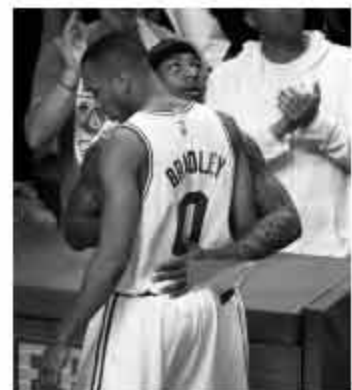
▲骑士阵中并没有像布拉德利一样给他填补漏洞的球员。

17-18赛季是小托马斯的合同年,如果他新赛季缺席了大部分比赛,或者数据下滑明显,到了赛季结束之后就很难得到一份顶薪合同。这对小托马斯来说是一个相当大的打击,毕竟他已经可以算是联盟一流的得分手,但他的伤病和新东家可能会给他带来负面的影响。