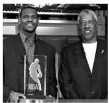
▲“J博士”一直都很看好詹姆斯。

欧文认为赢得多次冠军并且建立王朝是一件困难的事情,像UCLA,纽约扬基还有旧时代凯尔特人这样的王朝现在很难出现,但他也表示:“詹姆斯在克利夫兰和迈阿密,然后回到克利夫兰的个人成就使他处在一个独特的领域,这让他站在了大多数各时代最佳球员的肩膀上,包括我自己。你必须赞美他,从商业角度和个人角度而言,詹姆斯99%的时间都在做着正确的举动。就算他没有做出正确的决定,他也会努力让自己回到正轨。”