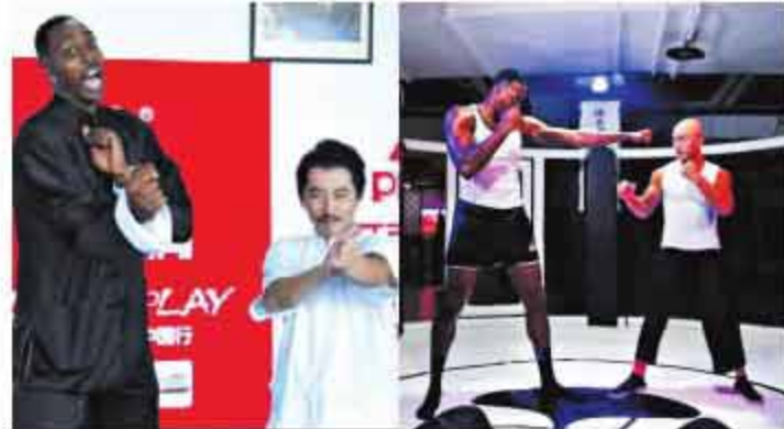
▲喜爱中国文化的霍华德此次大玩跨界,咏春、散打一一体验。

看来,正如一龙大师所夸赞的那样,对于中国武术,霍华德确实有着很高的悟性。当然,此次中国传统文化的体验,霍华德不单单只体验了武术,在宁波,他还听了昆曲,并且在之后的行程中他每天也都会不时的哼出听过的那些旋律。而在成都,他也亲自体验了一番功夫盖碗茶,只是这一项体验霍华德最终以失败告终,学习制茶技艺不精的他弄得茶水滴桌都是。不过,一向爱玩的他也是拿着一把长茶壶用各种方式逗得现场人员捧腹大笑,尽显其搞怪本色。最后,霍华德中国行的传统文化体验也在这一片欢声笑语中完美结束。