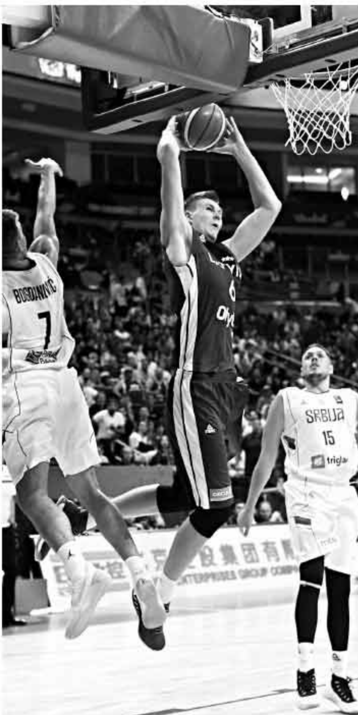
▲波神在篮下打出了统治级的表现,对手完全无法阻挡。

由于本届欧洲杯并不与世界杯和奥运会挂钩,包括“字母哥”在内的多位NBA球星选择缺席,新生代球员当中最耀眼的莫过于波神。如果他真的能像国际篮联说的那样,能带领拉脱维亚拿到奖牌并且拿到MVP的话,他在欧洲篮坛的地位就会一飞冲天。