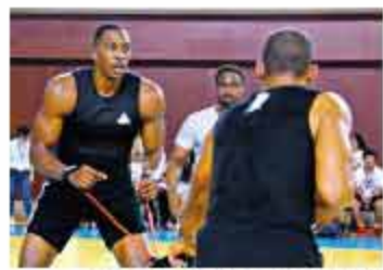
▲中国行期间霍华德也仍然不忘努力训练。

在过去半个月的时间里,霍华德在中国的行程也都是排得满满当当,多数时间都是在出席赞助商的各大活动,但不管每天工作到什么时候,他总是会挤出一些时间去训练,除了活动现场,健身房和篮球场也成了他在中国行期间每天必