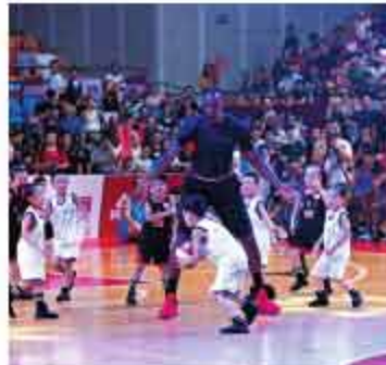
▲在活动中变身孩子王的霍华德希望未来能帮助中国的青少年篮球爱好者更好的成长。

“我知道中国有很多喜爱篮球的年轻人，他们也渴望能成为一名职业球员，但我觉得首先树