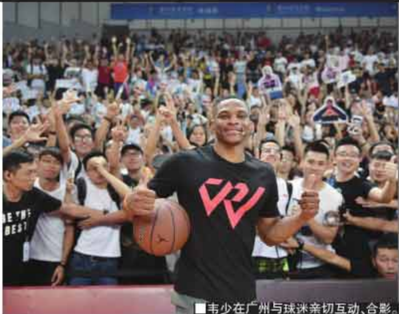
■韦少在广州与球迷亲切互动、合影。