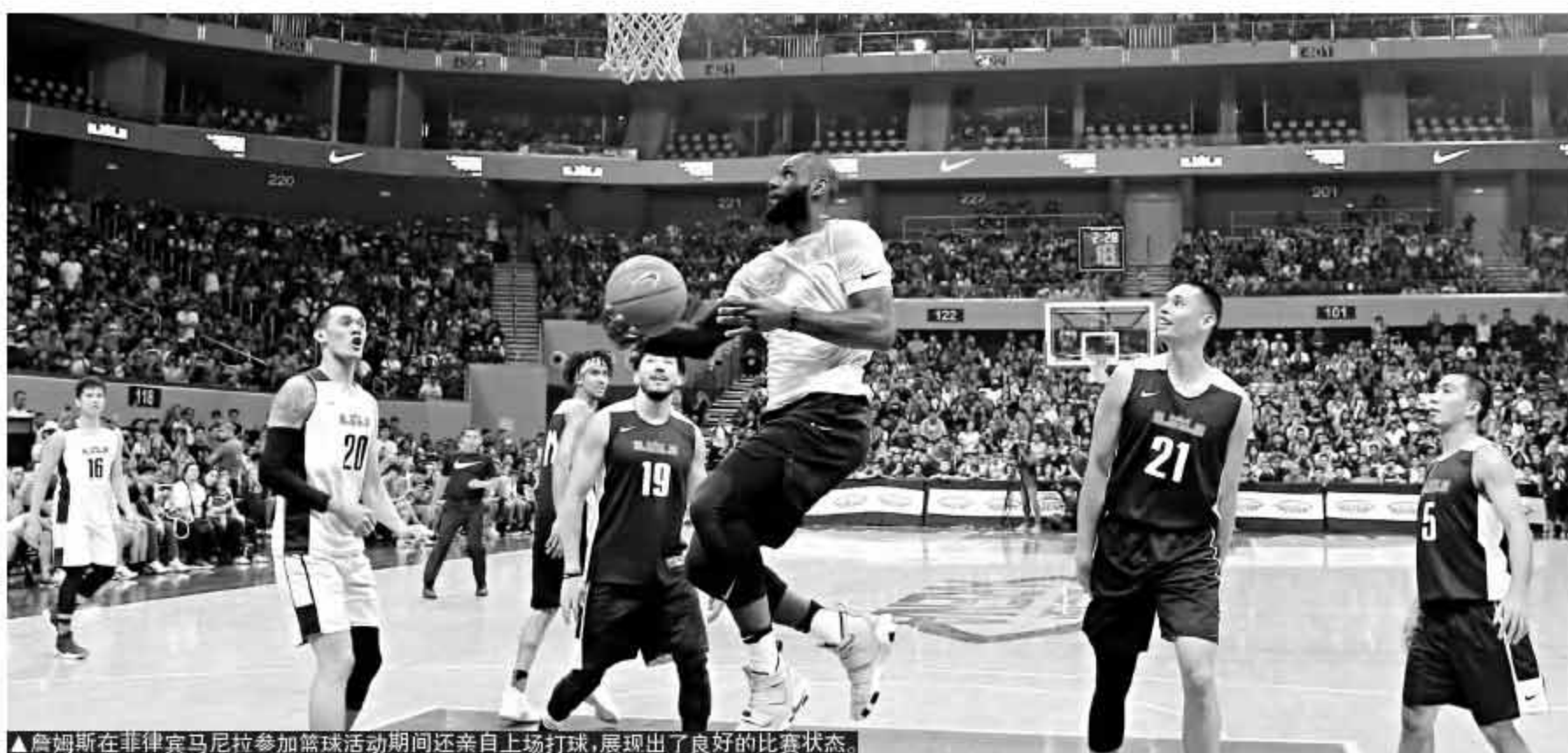
▲詹姆斯在菲律宾马尼拉参加篮球活动期间还亲自上场打球,展现出了良好的比赛状态。