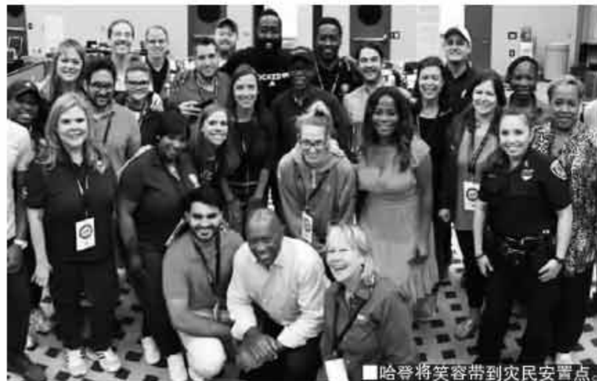
哈登将笑容带到灾民安置点。

2005年的卡特里娜飓风，使得当时那支黄蜂的主场球馆受到破坏，他们不得不将赛季的部分主场赛事搬到附近的俄克拉荷马举行。火箭的命运要稍好一些，他们的主场丰田中心目前来看不会对新赛季产生太大影响，对球迷来说，这算是个不幸中的万幸了。