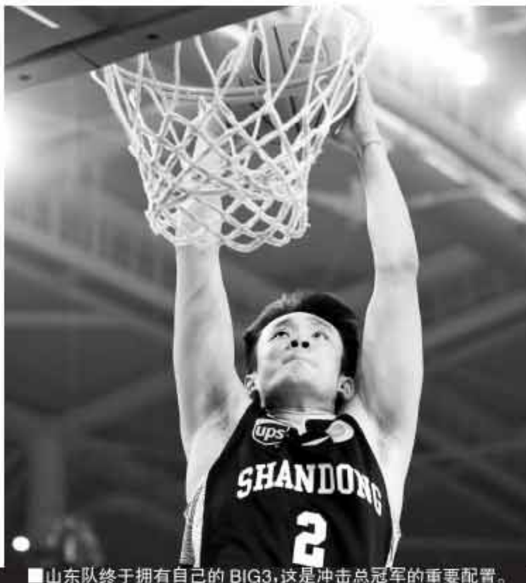
■山东队终于拥有自己的BIG3,这是冲击总冠军的重要配置。