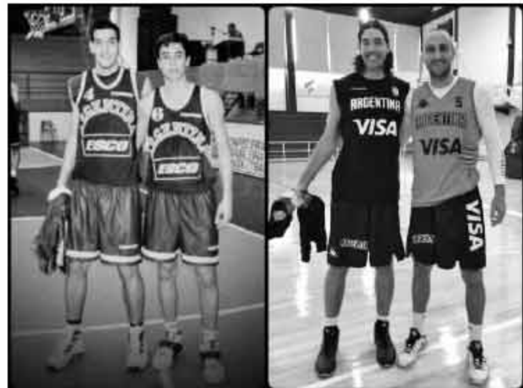
▲斯科拉与马努20年前与现在的对比照,两人友谊已超越了篮球本身。

“当初大家都不看好他的篮球生涯,相反地,他成为了如今这届最勇敢的竞争者。”谈到这位20多年的老友,斯科拉总是替他骄傲。