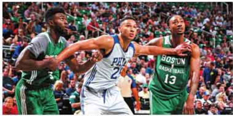
▲西蒙斯去年已经在夏季联赛中展现了自己的实力。

这个因为左脚韧带骨折而缺席新秀赛季的天才终于得到了重返赛场的机会,而在一年前的夏季联赛中,他已经展现了自己恐怖的球场视野和组织技术。如果有人忘记的话,不妨拿西蒙斯来和今年夏季联赛状态