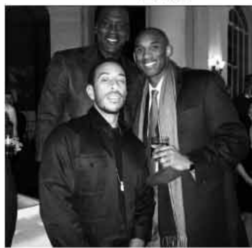
他写道:“回吧,他们笑了,说你还是坚持说唱吧。丹科比的合影,我跟他们说,咱们一起参加美国演员卢达克斯斯上传了一张自己与乔”