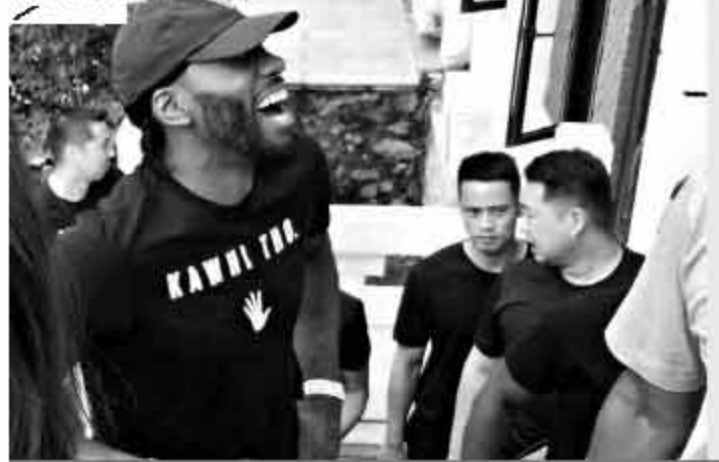
马刺核心莱昂纳德日前登上了长城,一向不苟言笑,被球迷戏称为“面瘫”的他居然放声大笑,让人看到了他的另外一面。