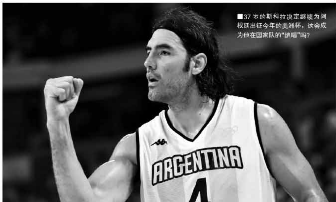
■37岁的斯科拉决定继续为阿根廷出征今年的美洲杯,这会成他在国家队的“绝唱”吗?