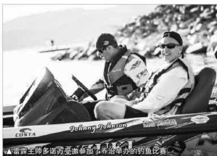
▲雷霆主帅多诺万受邀参加了乔治举办的钓鱼比赛。

乔治此前也表达了自己的看法,他认为韦少是一位非常出色的队友,“在他身边不用担心球权分配,他是一个很好的进攻发起点,也是一个很好的终结点。他在场上的激情与活力总能带动和感染队友。”乔治说道。