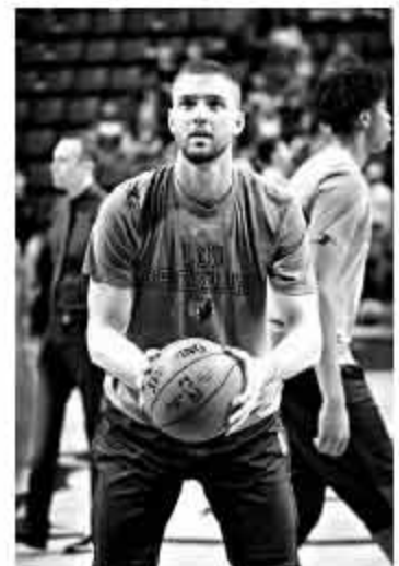
▲帕森斯找回状态的话，灰熊还有机会杀入季后赛。

的确，健康对任何一支球队来说都至关重要，像勇士、骑士和马刺这样的球队，他们之所以取得了成功，正是因为他们在正确的时间保持健康，或者克服了伤病的影响。而如果灰熊因为伤病导致无缘季后赛，小加离开的心思或许会更加坚定。