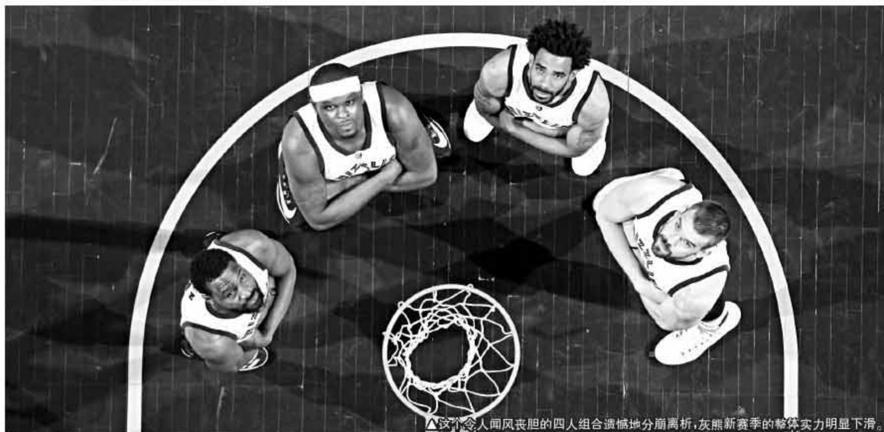
这个令人闻风丧胆的四人组合遗憾地分崩离析，灰熊新赛季的整体实力明显下滑。