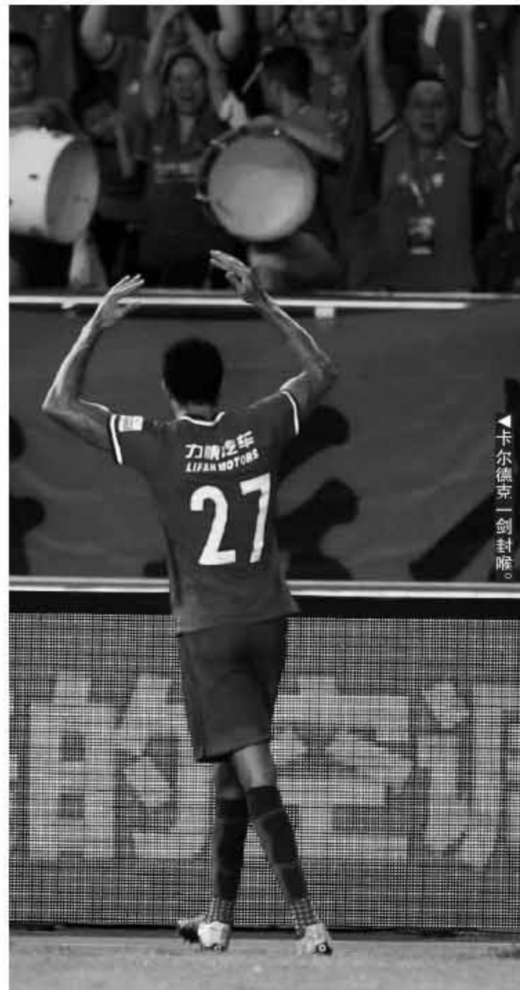
卡尔德里克一剑封喉。

一旦塔尔德利缺席,鲁能的进攻只剩下两个办法,一是后场长传找佩莱,二是中场控制后分边,边路进行突破或者传中,中路包抄射门。