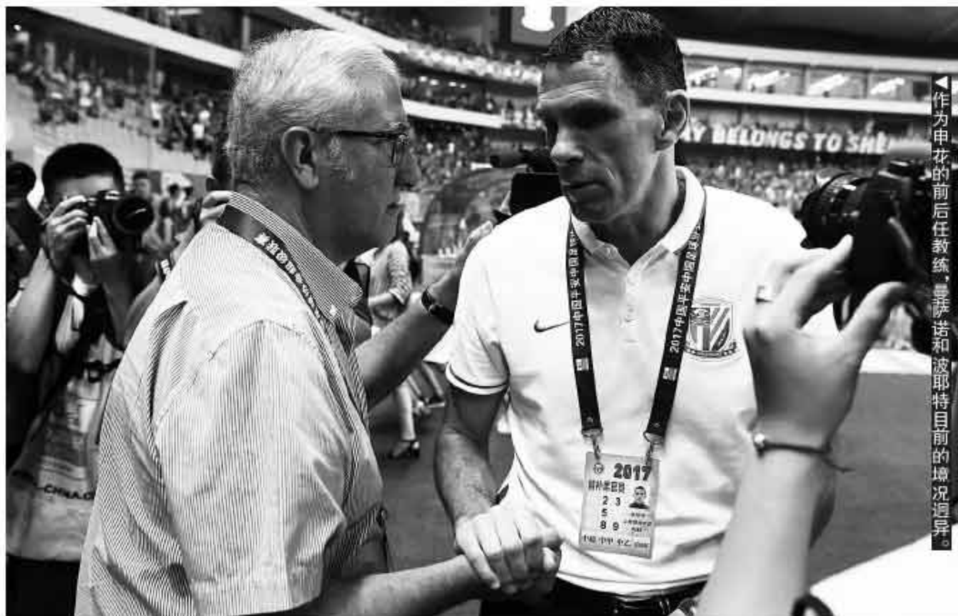
作为申花的前后任教练,曼萨诺和波耶特目前的境遇迥异。

场外,双方的言语都开始有点针对,不过,当曼萨诺真正重回虹口,还是有很多温馨的画面。周二的晨练,曼萨诺乘坐的商务车刚刚抵达虹口足球场,一群申花球迷就开始围上去要求签名,曼萨诺为了满足球迷的愿望,开始一一签名,但是人越来越多,为了保证发布会的正常进行,贵州队的工作