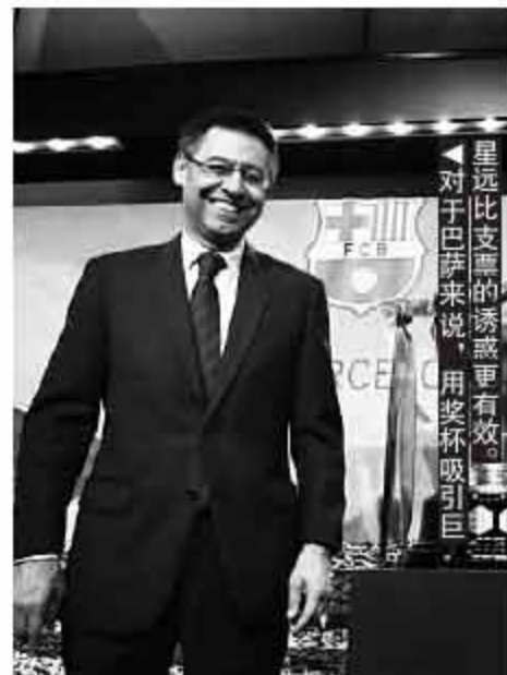
星远比支票的诱惑更有效。对于巴萨来说,用奖杯吸引巨

巴萨管理层非常清楚,奖杯才是硬道理。只要巴萨仍然具备冠军竞争力,守住在拉丁世界和远东的基本盘,就可以为下一个世界级巨星做好竞价准备。