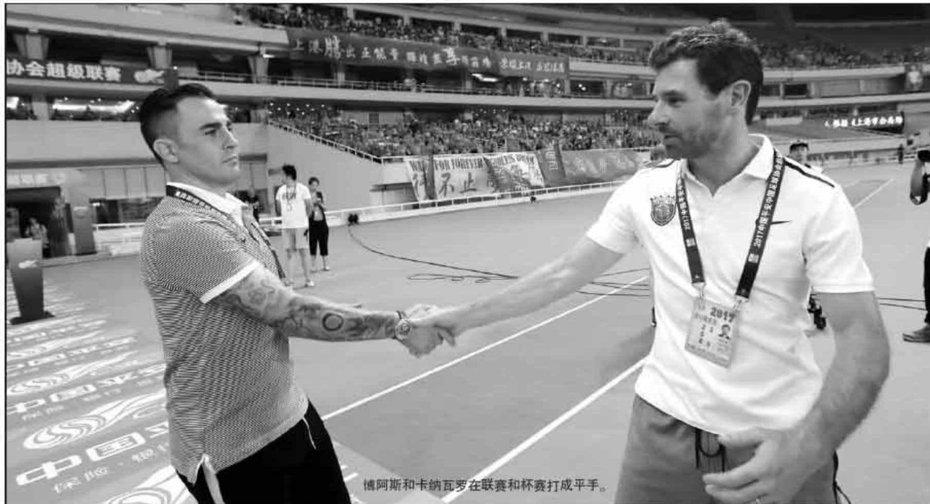
博阿斯和卡纳瓦罗在联赛和杯赛打成平手。

记者陈伟报道 足协杯四分之一决赛次回合，上港在主场完成了大逆转，但是联赛中，上港却在权健身上“马失前蹄”，主场被扳平，上港和恒大的差距拉大了3分，三线作战挑战恒大，上港在联赛中已经落后。