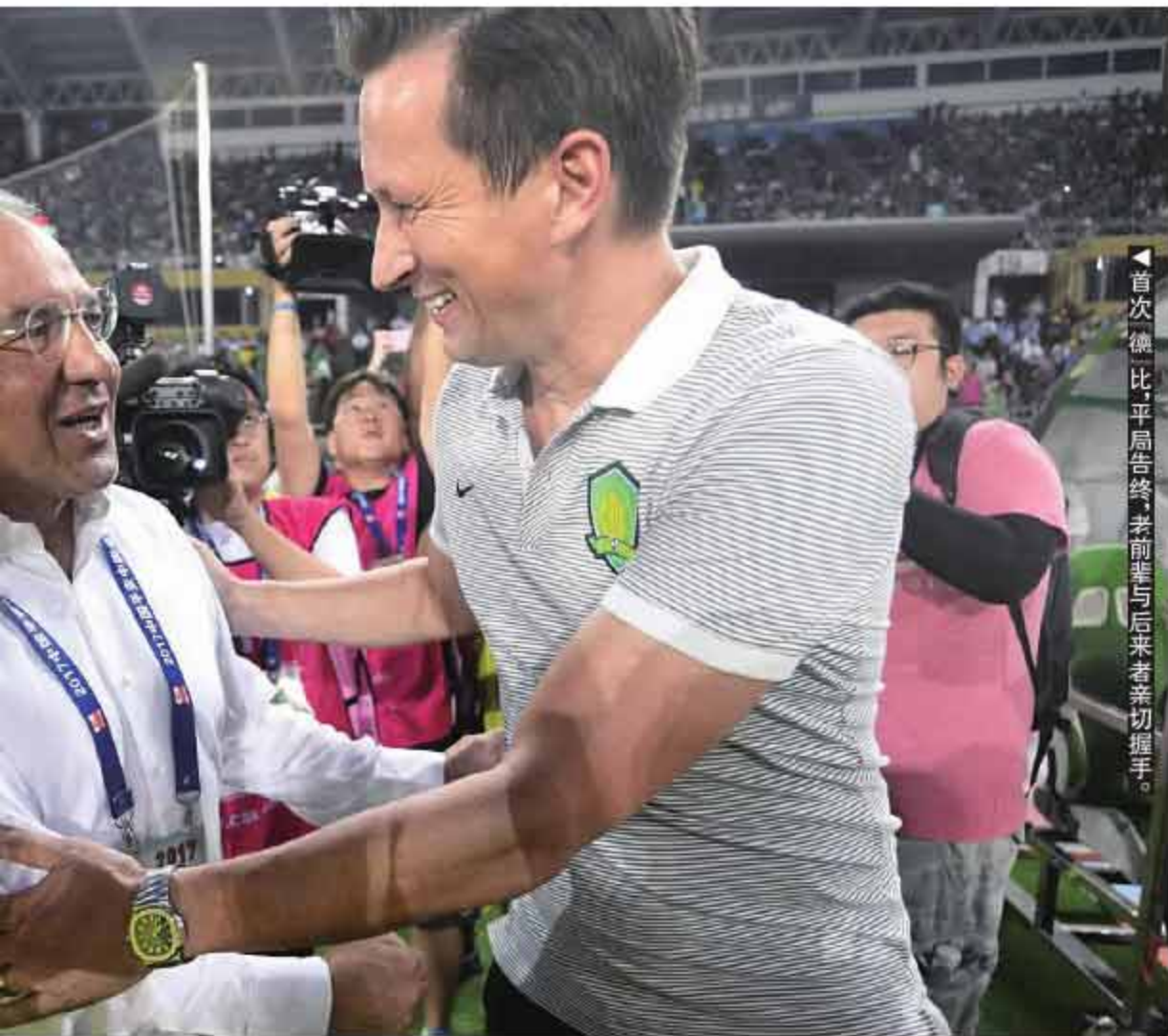
首次德比平局告终，赛前菲与后来者亲切握手。