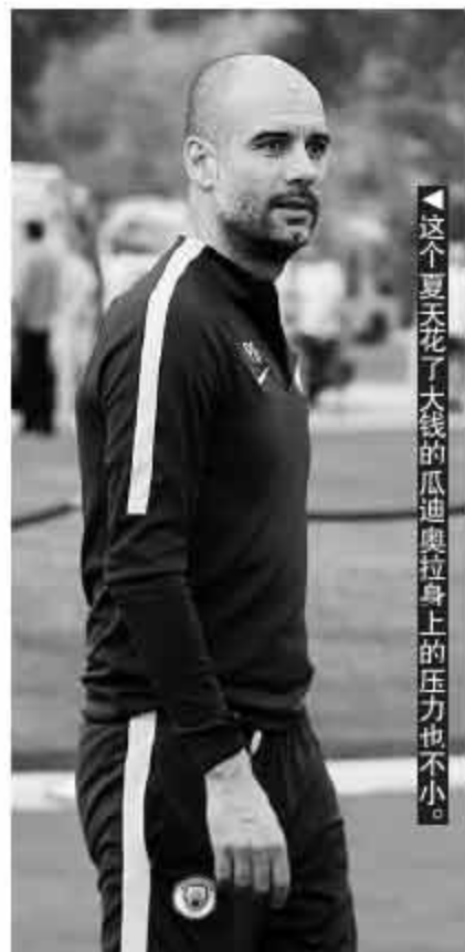
这个夏天花了大钱的瓜迪奥拉身上的压力也不小。