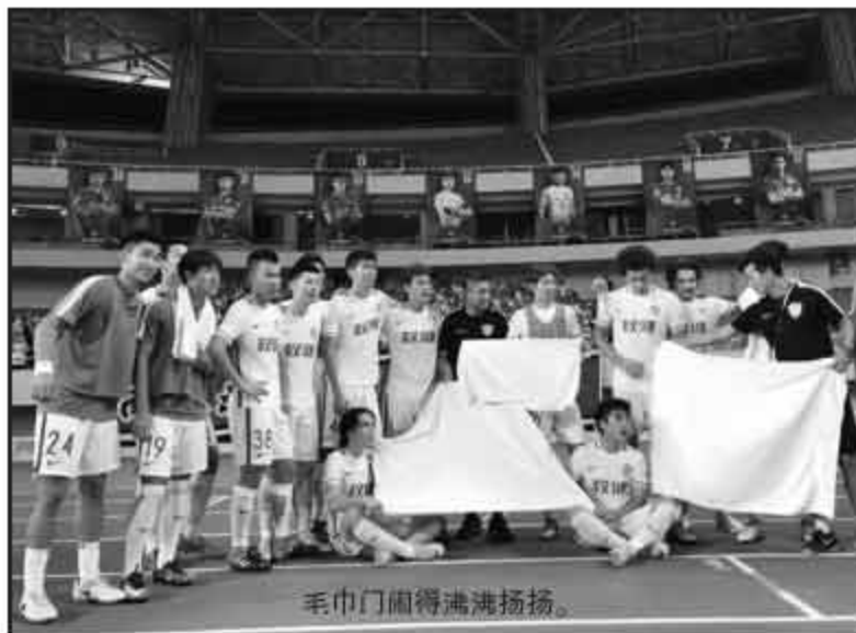
毛巾门闹得沸沸扬扬。

总结足协杯,三外援首发,准主力尽出,结果70分钟时间便被对手四度洞穿球门,圈中的足协杯失利,无疑是卡纳瓦罗执教权健以来的最惨痛回忆。与去年足