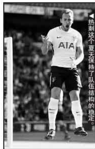
热刺这个夏天保持了队伍结构的稳定。

上半场，菲尔米诺在禁区内被对手一个抱摔放倒在地，亲自主罚点球命中。为了让年轻球员获得比赛时间，下半场克洛普替换了10名球员，包括索兰克、肯特、伍德伯恩这样的年轻球员获得了上场时间。青训营产品伍德伯恩在上半场，大禁区外假动作晃开防守球员一脚远射破门。前切尔西球员索兰克第80分钟的头球破门，角度非常刁钻，他也延续了季前赛中出色的进球状态。