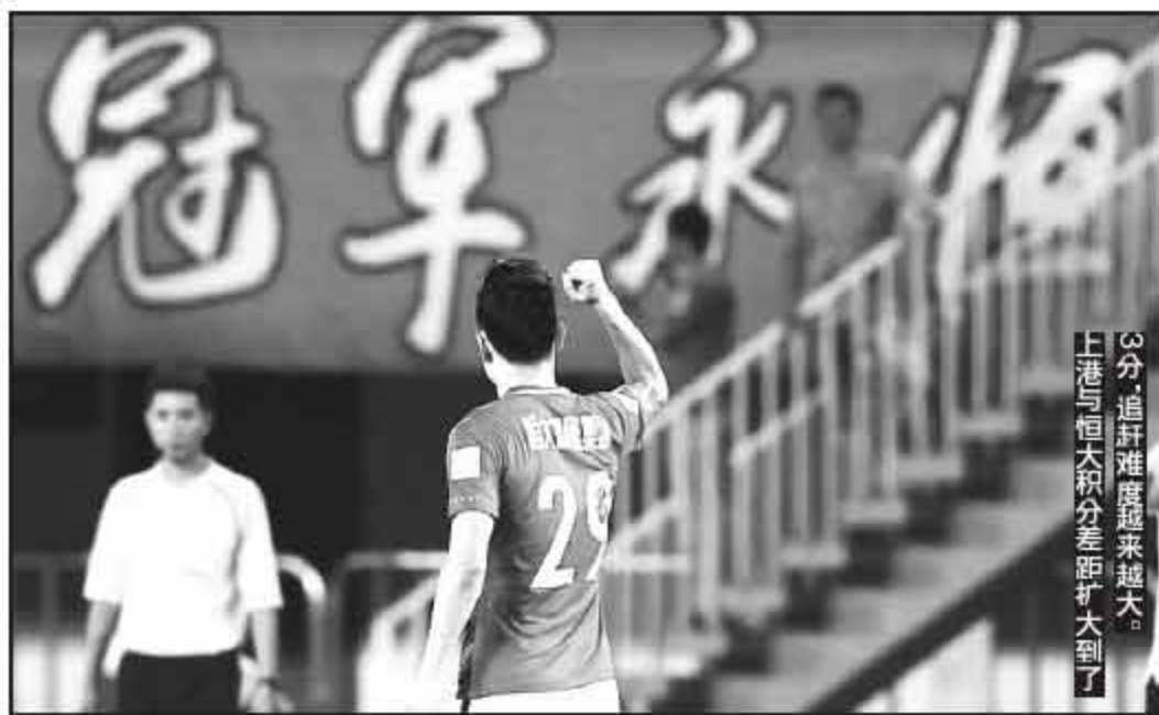
3分,追赶难度越来越大。上港与恒大积分差距扩大到1