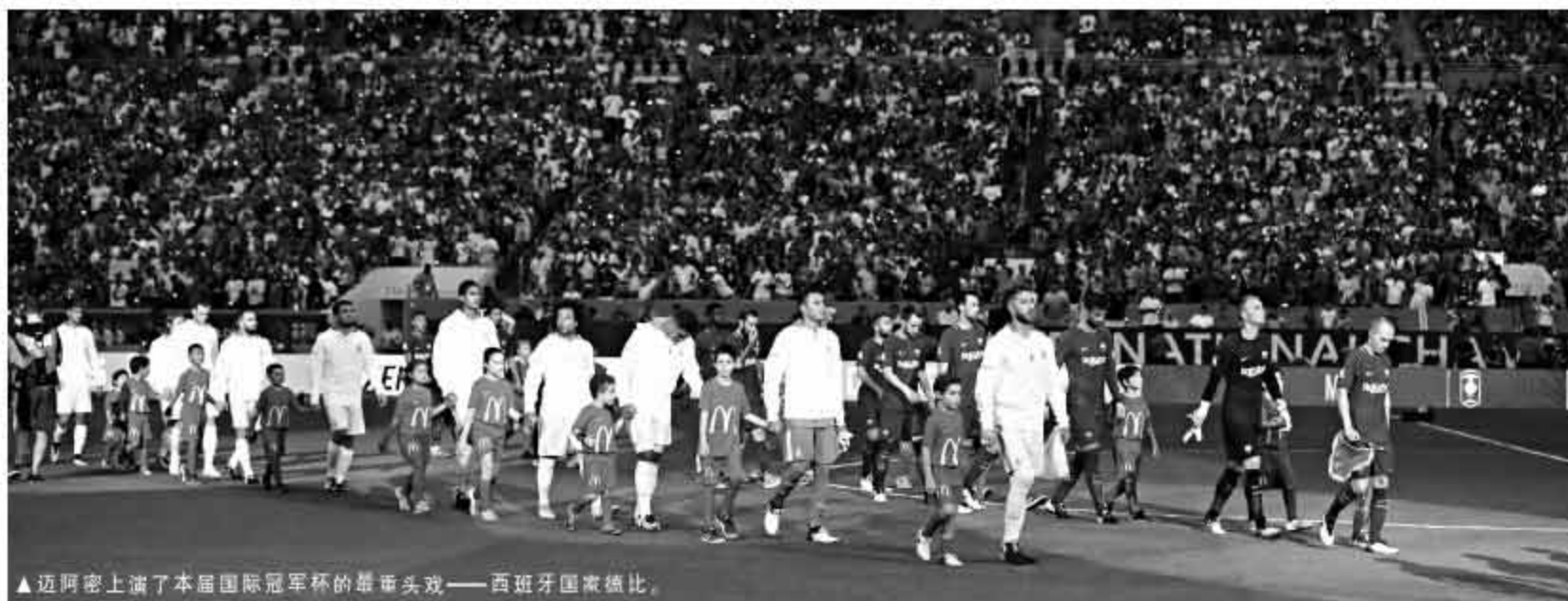
▲迈阿密上演了本届国际冠军杯的最重头戏——西班牙国家德比。