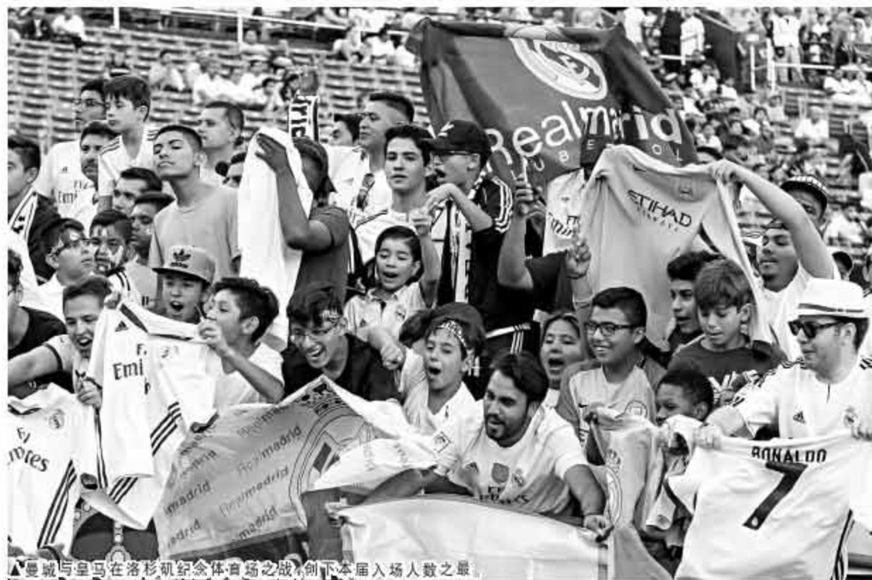
▲曼城与皇马在洛杉矶纪念体育场之战,创下本届入场人数之最。

点评:美国赛区的比赛集中 8 大豪门,对阵上没有一场是像中国和新加坡赛区那样让进球数达到 1 球以上的赛事,0/0.5 和 0.5 球盘贯穿美国赛区的 12 场比赛中的 11 场,最终上下盘的数量也趋于平衡,比例为 5 比 6 下。 巴萨成为最大赢家,他们 3 场赛事面对尤文、曼联和皇马,都排在让 0.5 球之下,最终以 1 球小胜曼联,比分也分别打出 1 比 0、2 比 1 和 3 比 2。正如本报在本届国际冠军杯综述文章中强调,巴萨在新帅巴尔韦德的率领下,本届派出了除斯特林之外的所有主力出征,最值得看好的豪门。结果他们果然不负所托,本季度正下以 3 战全胜