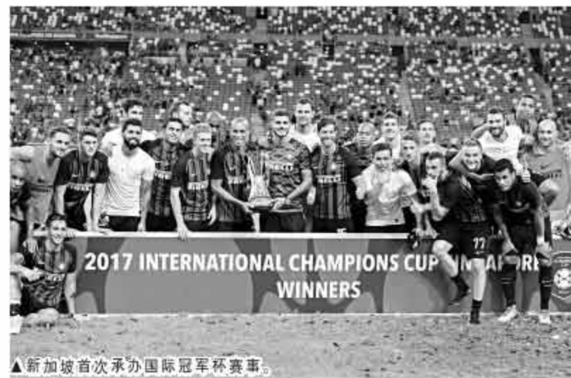
▲新加坡首次承办国际冠军杯赛事。