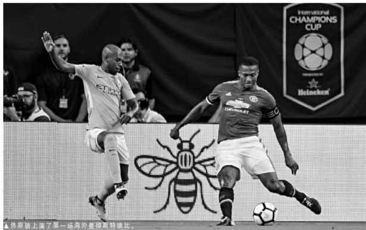
▲休斯敦上演了第一场海外曼彻斯特德比。