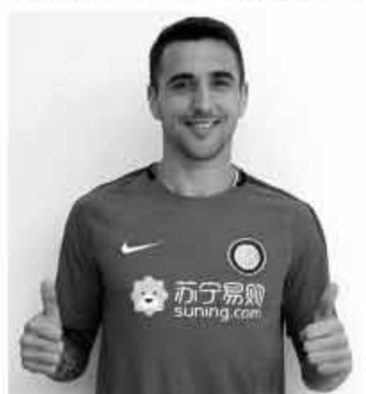
■新援中场维奇诺已到位。

贝尔戈米对国米阵容的诊断是“缺真正的前腰”，“马里奥和布洛泽维奇都不是。这个位置要么放个有进球保障的二前锋，约维蒂奇肯定不行。要进前四得有80-85个进球，光靠伊卡尔迪、佩里西奇、坎德雷瓦绝对不够。我认为还缺个重量级中后卫。听说要买达尔伯特，太对了，边后卫需要这样的进攻能手。”另一国米旗帜，1960年代大国际主力科尔索也认为前腰位置该引援，“比达尔最合适，攻守兼备又能插上进球。他在佩里西奇、坎德雷瓦中间就完美了。”可惜拜仁不放人。