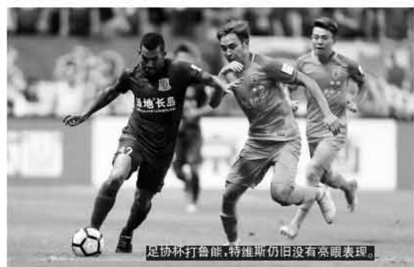
足协杯打鲁能,特维斯仍旧没有亮眼表现。