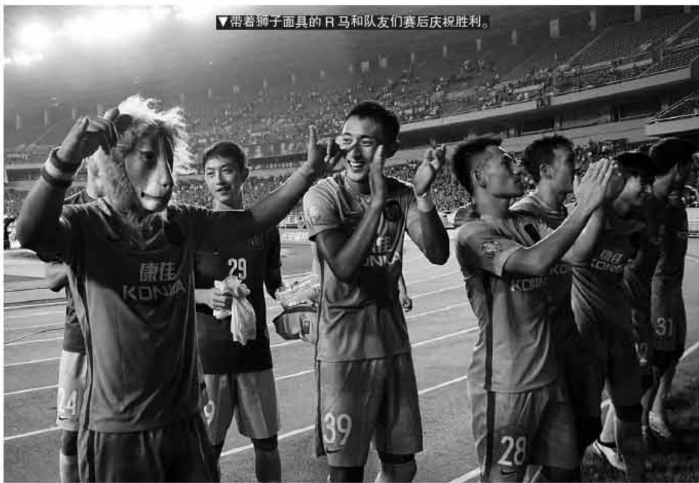
带着狮子面具的R马和队友们赛后庆祝胜利。

竞技层面以外的“玄学”还有很多,近的例子有和苏宁类似的富力,将原本蓝色的主场刷成金色后就不断赢球,而年代久远的则有当年上海老帅徐根宝赛前到特定的场所喝咖啡,穿布鞋指挥比赛。在场内外心理暗示的作用下,无论是教练还是球员,或多或少都会受到一些影响。