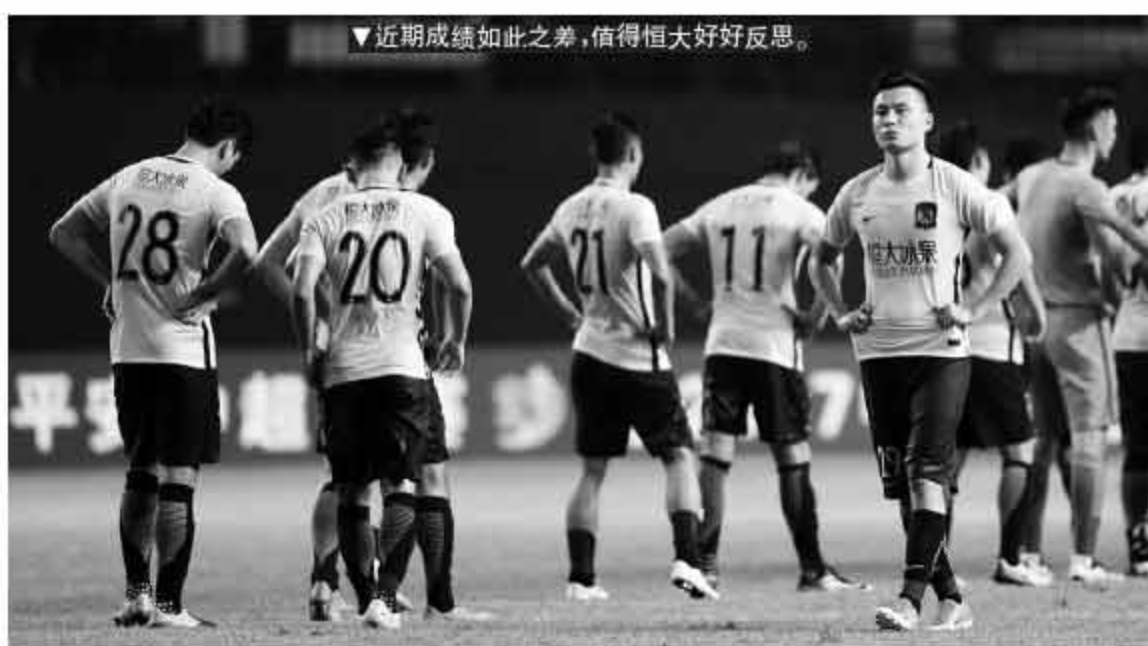
近期成绩如此之差，值得恒大好好反思。